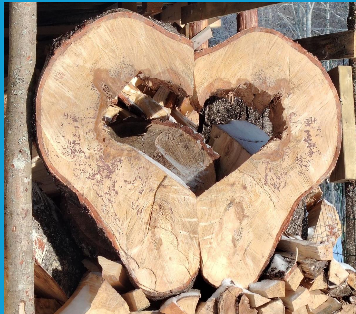
Hyvänmielen sydän Kirkolantiellä