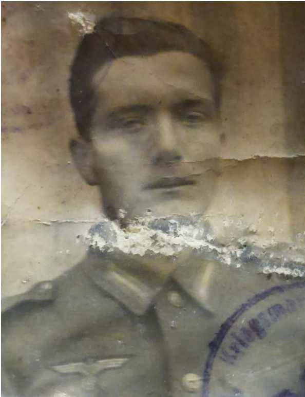
Saksalaisen sotavangin melko huonokuntoinen valokuva löytyi entisen Äinä-Vähimaan koulun lattian alta vuonna 2025. Kuvan lähetti Otto Virtanen.

Asikkalassa toimi Vääksyn Yhteiskoululla neljän viikon ajan sotavankileiri n:o 40. Vääksyn pääleirin lisäksi alaleirit sijoitettiin Iso-Äiniölle; Äinä-Vähimaan koululle, seuran- ja työväentaloille sekä Viitailaan. Yhteensä niissä oli yli 1500 saksalaistasotilasta tai -vankia.