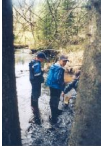
Kuvissa vasemmalla 4H-nikkarikerho Uudenmyllyn laavulla 10.6.

Viime syksynä toimintansa aloittanut Äinä-Vähimaan koulun 4H-nikkarikerho valittiin keväällä vuoden 4H-kerhoksi Asikkalassa.