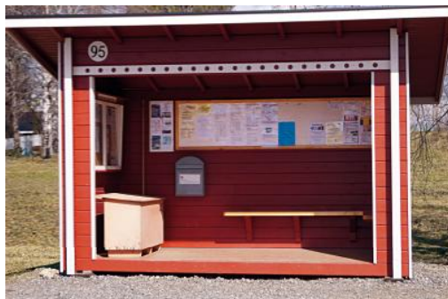
Päijät-Hämeen kylät ry:n palkitseva infokeskus