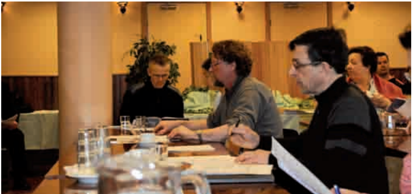
Kokouksen osanottajat seurasivat tiiviisti kokouksen kulkua.

vastuualueet määriteltiin heti liittokokouksen jälkeisessä hallituksen kokouksessa ja ovat nähtävillä nettisivuillamme ja toisaalla tässä lehdessä.