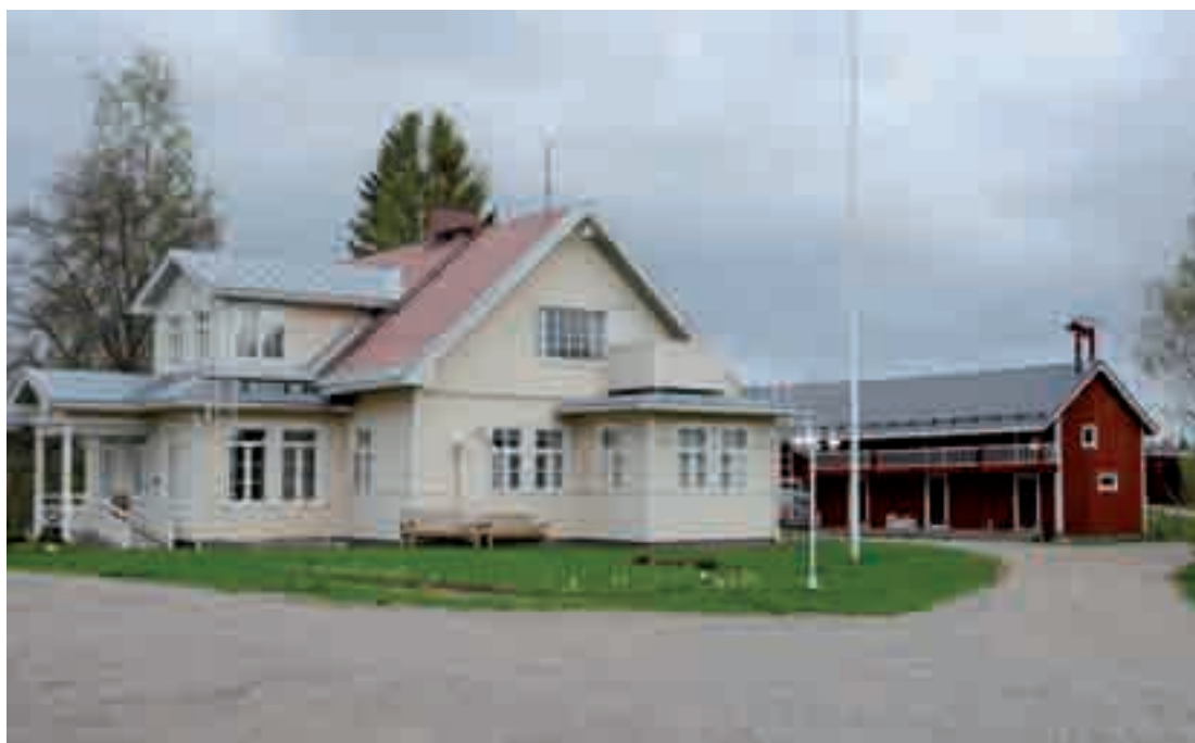
Vehmaskoti on perustettu vanhan sukutilan historialliseen pihamiljööseen.

V ehmaskoti sijaitsee vanhalla sukutilalla keskellä Savoaa, 15 km Pieksämäeltä Mikkeliin päin. Paikalla on asuttu ainakin 1600-luvulta lähtien. Riipisen sukua tunnetaan tilan omistajina 1740 alkaen. 1800-luvun lopulta, Savon radan valmistumiseen asti paikalla toimi kestikievari. Vanhan kestikievarin paikalla oleva, tilan vanha pääpaikka tunnetaan myös tilan nimellä Peltola.