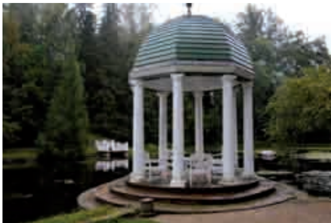
Palmsen kartanon huvimaja.

10 vuodessa Tallinna on kehittänyt ja kaunistunut valtavasti, mutta Koplia, ennen kalastajien ja merimiesten asuttamaa kaupunginosaa, sivistys ei ole saavuttanut.