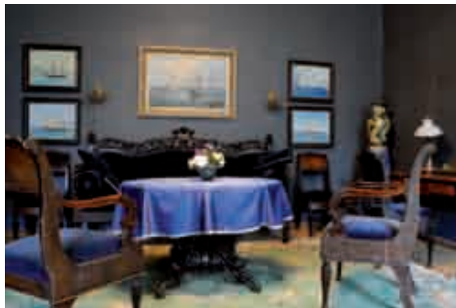
Sagadin kartanon sininen huone.

aikanaan Viron suurin, sen sijaan koki kovia venäläisten asuttamana. Lähes 50 vuoden tuhoamisvimma on jättänyt surua herättävät jäljet aikanaan niin komeaan kartanoon. Ei voi kuin toivoa, että jostain löytyisi varat sen korjaamiseen.