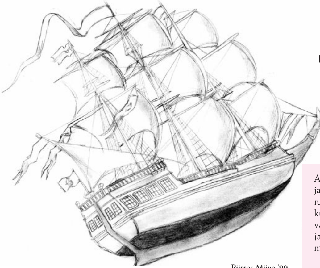
Piirros Miina '99