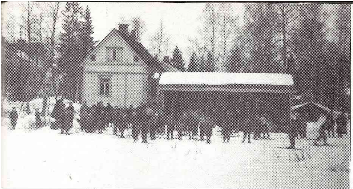
Hiihtokilpailu Aseman koululla 1950-luvun lopulla.