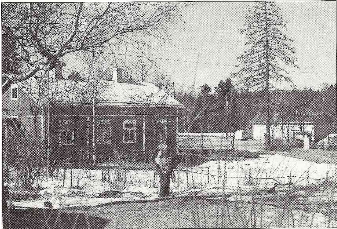
Kaksi kuvaa entisestä Rantalan majatalorakennuksesta. Ylempi on 1970-luvulta, jolloin kuisti oli vielä vanhassa asussaan. Alemmassa kuvassa on rakennus kuvattu Karjasillantien puolelta 1980-luvun lopulla.