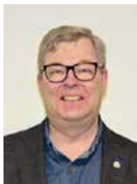
Hans Brummer Autohistoriallinen Seura ry