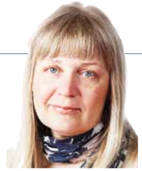
Hannele Hatanpää Autohistoriallinen Seura ry

V iime Morjensissa pääsin kirjoittamaan, että EU:ssa on ollut tolkkuisempia kantoja liittyen ajoneuvojen käyttövoimiin. Samaa ei voi sanoa EU komission ajoneuvojen kiertotalousvaatimuksiin ja romuajoneuvojen jätehuoltoon liittyvän asetusehdotuksen (ELV) kohdalla. Sen lopullisesta muodosta päätetään syksyllä ja siihen tarvittavia muutoksia sorvataan parhaillaan mikä vaatii ajoneuvoharrastajien aktiivisuutta tuoda kiireellä ja suurella joukolla esiin asetuksen valuviat.