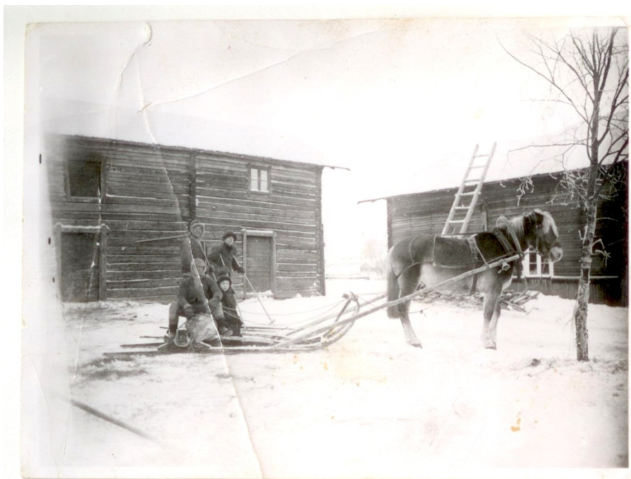
Talvipäivä Ala-Auvilan pihalla 1920-luvulla