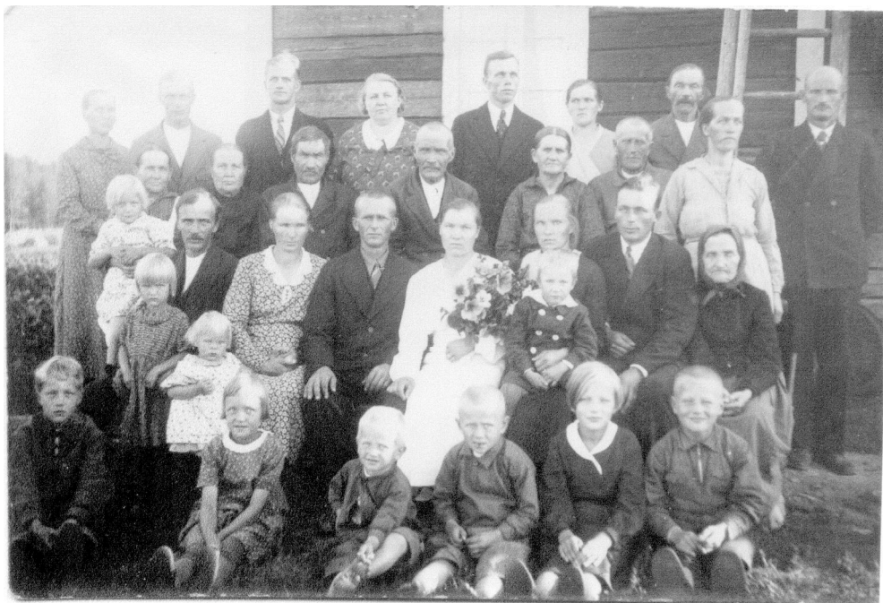
Hääkuva Pitkältäkoskelta 26.8.1934: