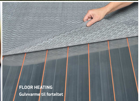
FLOOR HEATING Gulvvarme til forteltet