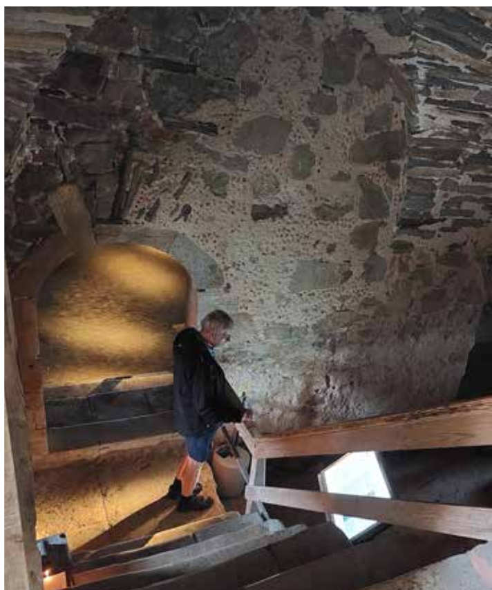
Trappan leder ner till köket, genom de enorma, välbyggda stenväggarna.