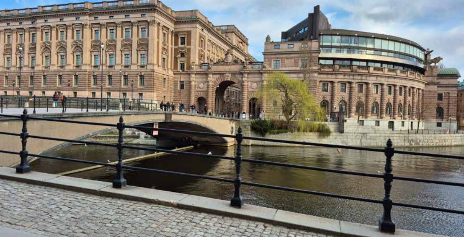
Riksdagshuset och Riksbron