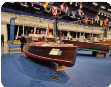
Fint renoverade träbåtar

Det blev även besök i hallen med tillbehör och veteranbåtar innan vi åkte tillbaka till förorten. På kvällen höll vi traditionen vid liv och åt plankstek på Bistro Bar i Rönninge, och kvällen avslutades med grogg i soffan hemma.