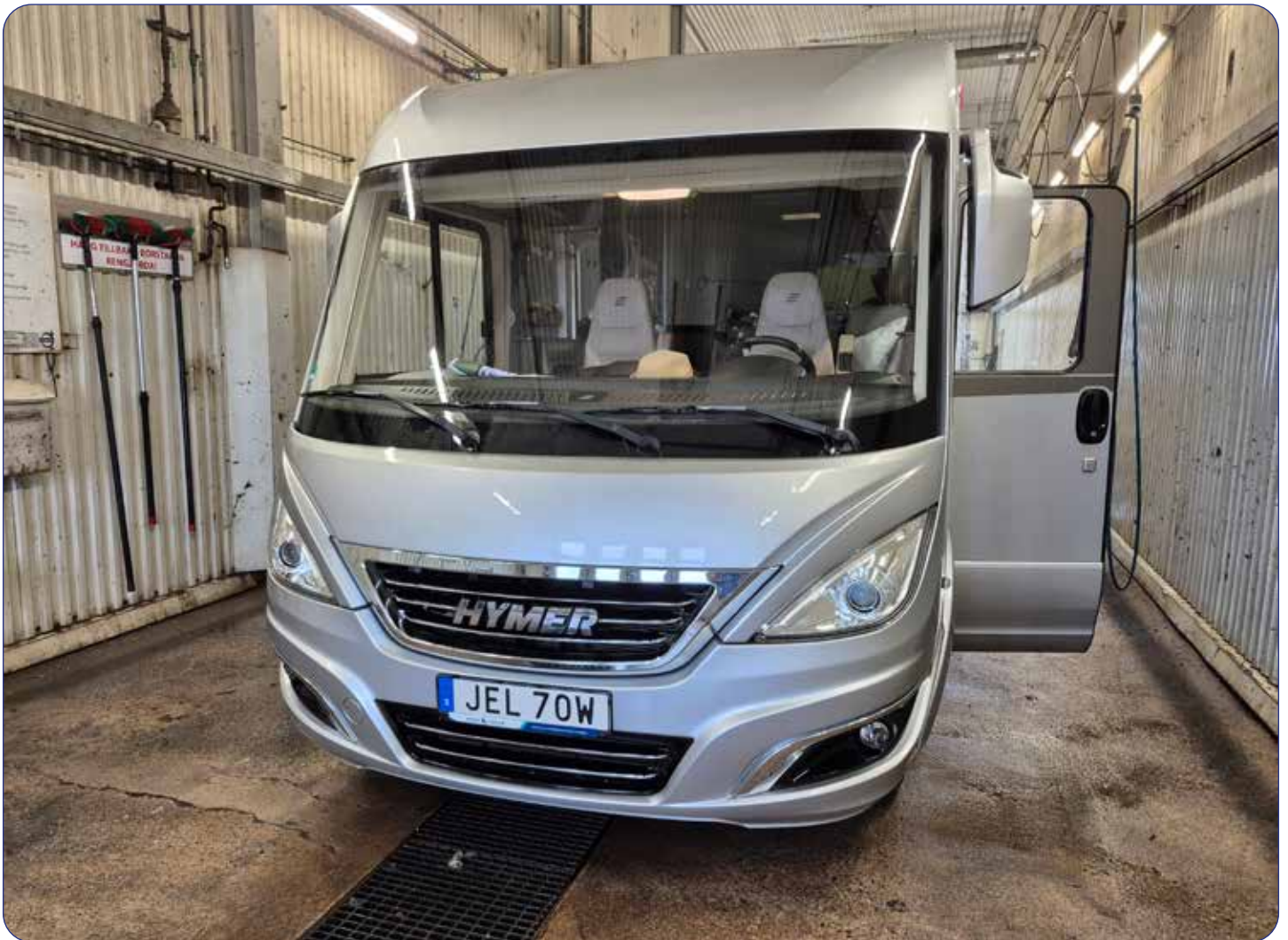
Spåren av saltad väg är borta.