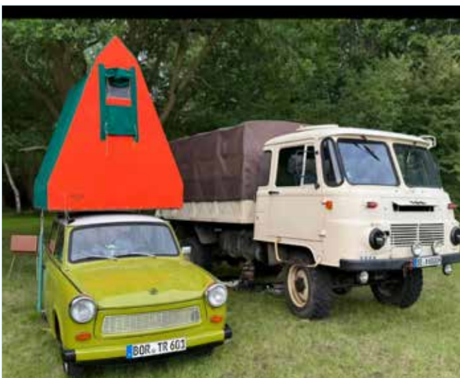
Husbil från gamla DDR