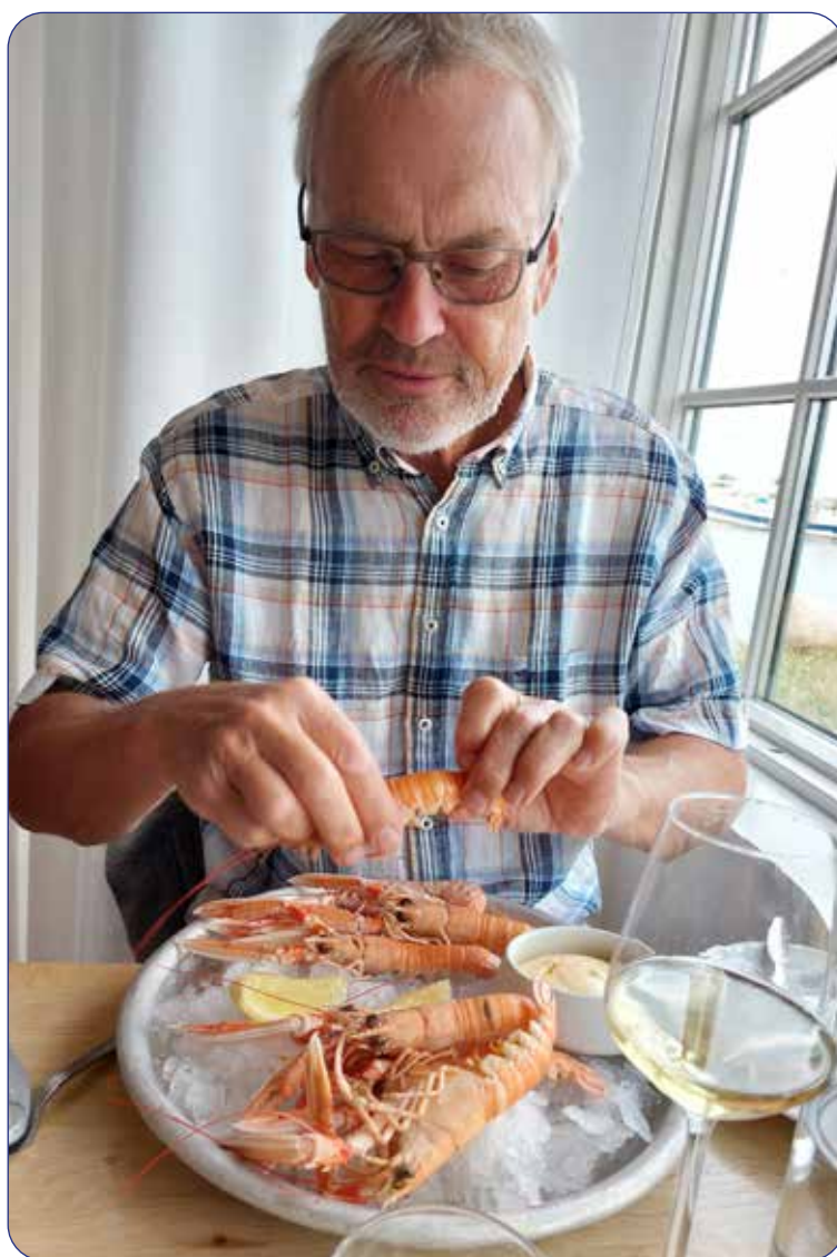
Restaurangbesök belönade dagens djupdykning.