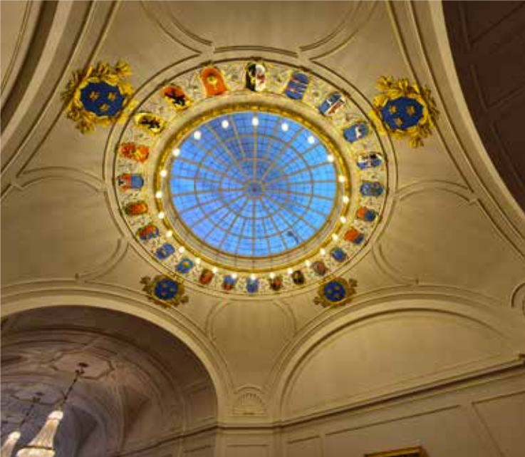
Takkupolen i Samanbinningsbanan