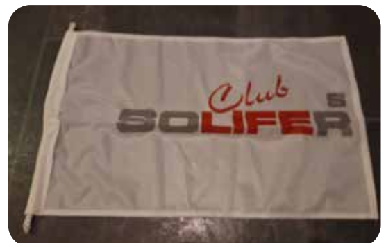
Flagga 50X30 cm 30:- Frakt tillkomer