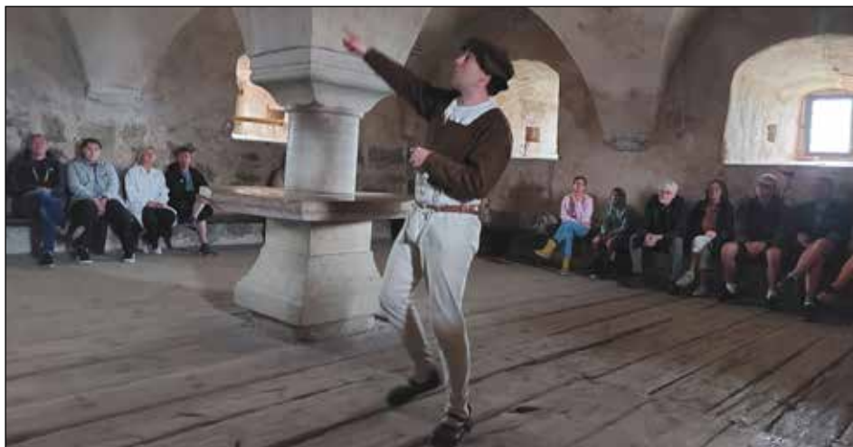
Guiden gjorde livet i borgen levande för oss