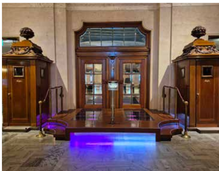
Fina telefonkiosker i entrén