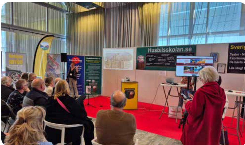
Freedom Travel delade monter med Husbilsskolan