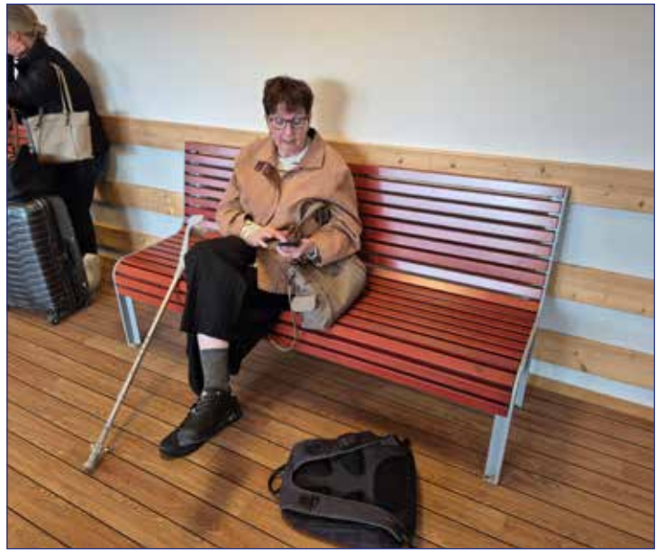
Väntan på ombordstigning