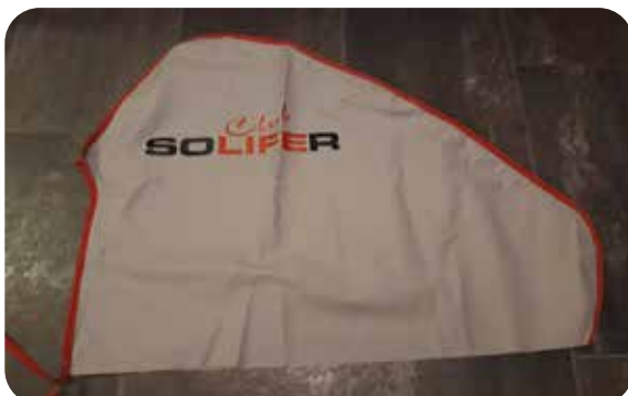
Dragskydd 50:- Frakt tillkommer

OBS! Anmälan är bindande! Ingen el kommer att finnas tillgänglig!