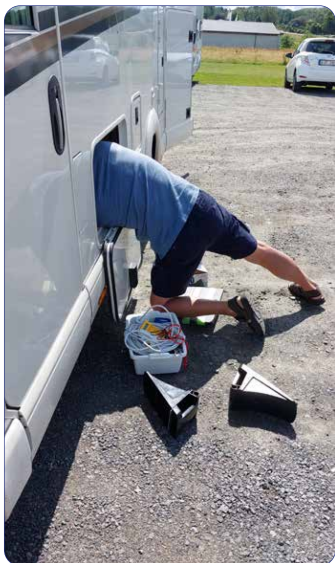
Djupdykning med sikte på trasig vattenpump.