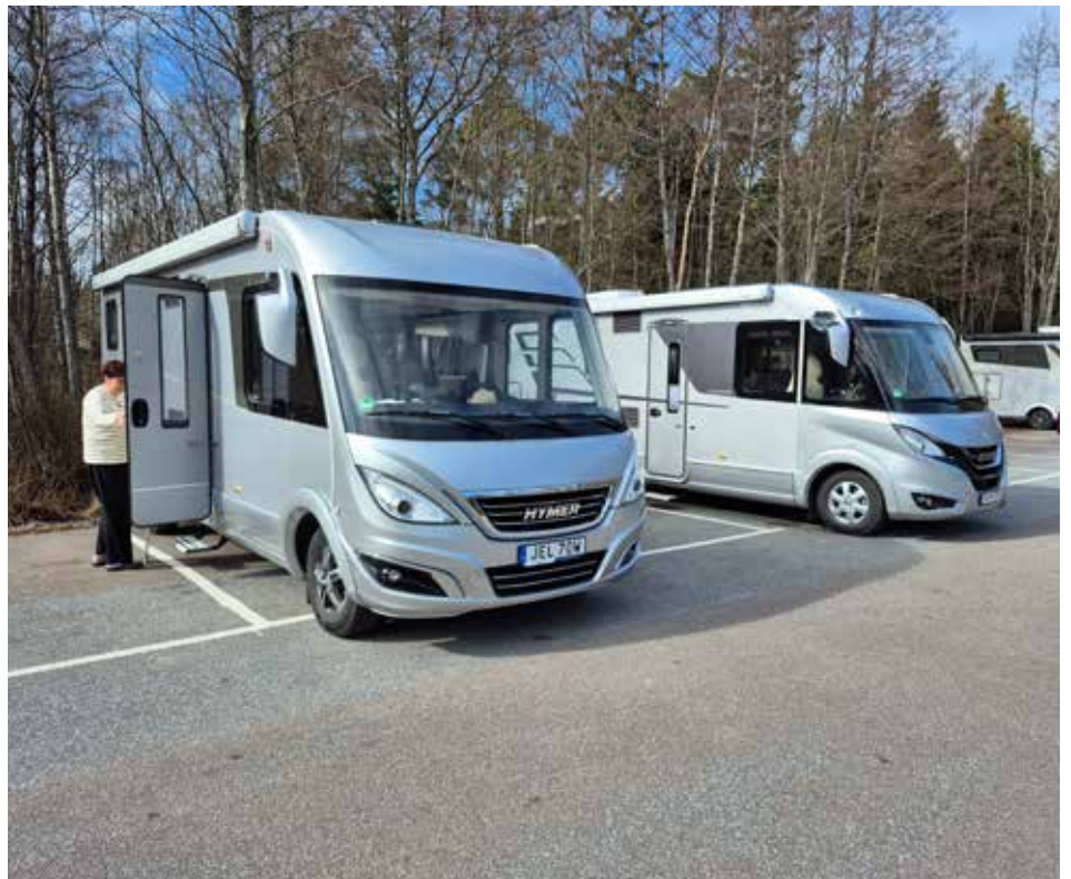
Inre parkeringen i Grisslehamn 150:- per dygn, nära till båten.