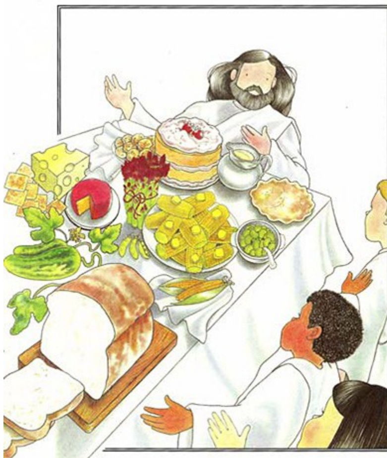
Kuva Karitsan häjä-ateriaalta, joka on otettu tohtori Reagan'in lapsille tarkoitettusta profetia-kirjasta. Kuvan on tehnyt taiteilija Paula Lawson.

Toinen juhlaillallinen, jota kutsun Siionin pidoiksi, järjestetään täällä maan päällä Jerusalemissa Jeesuksen paluun jälkeen. Siihen osallistuvat Vanhan Testamentin pyhät ja Ahdistuksen marttyyrit, kuten myös seurakunta-ajan pyhät. Sen tarkoituksena on juhlia Herran paluuta ja Hänen tuhatvuotisen valtakuntansa avaamista.