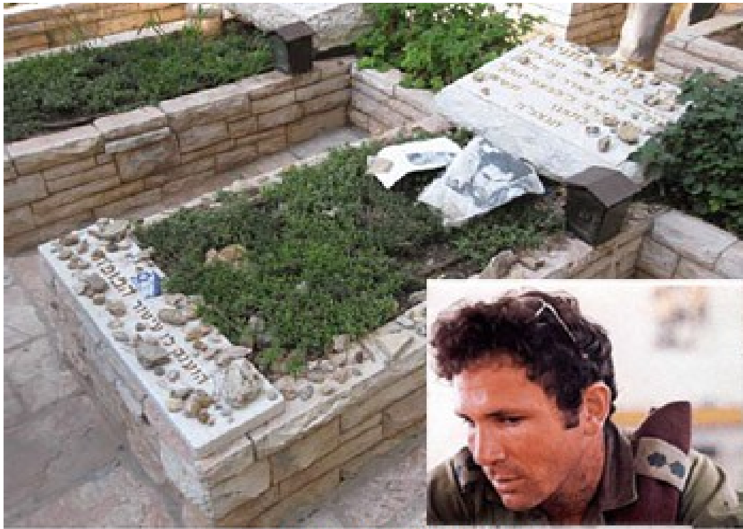
The grave of Yoni Netanyahu at the Mount Herzl Cemetery in Jerusalem.

Tätä päättäväisyyttä on testattu useaan otteeseen. Jasser Arafatin yllättämiä intifadoja (arabiaksi "kapina") on seurannut Hamasin hyökkäykset Gazassa ja Hizbollahin hyökkäykset Libanonissa. Suuret ja pienet yhteenotot ovat asettaneet Israelin hämää ja häikäilemätöntä vihollista vastaan. Mutta kerta toisensa jälkeen, vaikkakin verisenä ja murheellisena, Israel on voittanut.