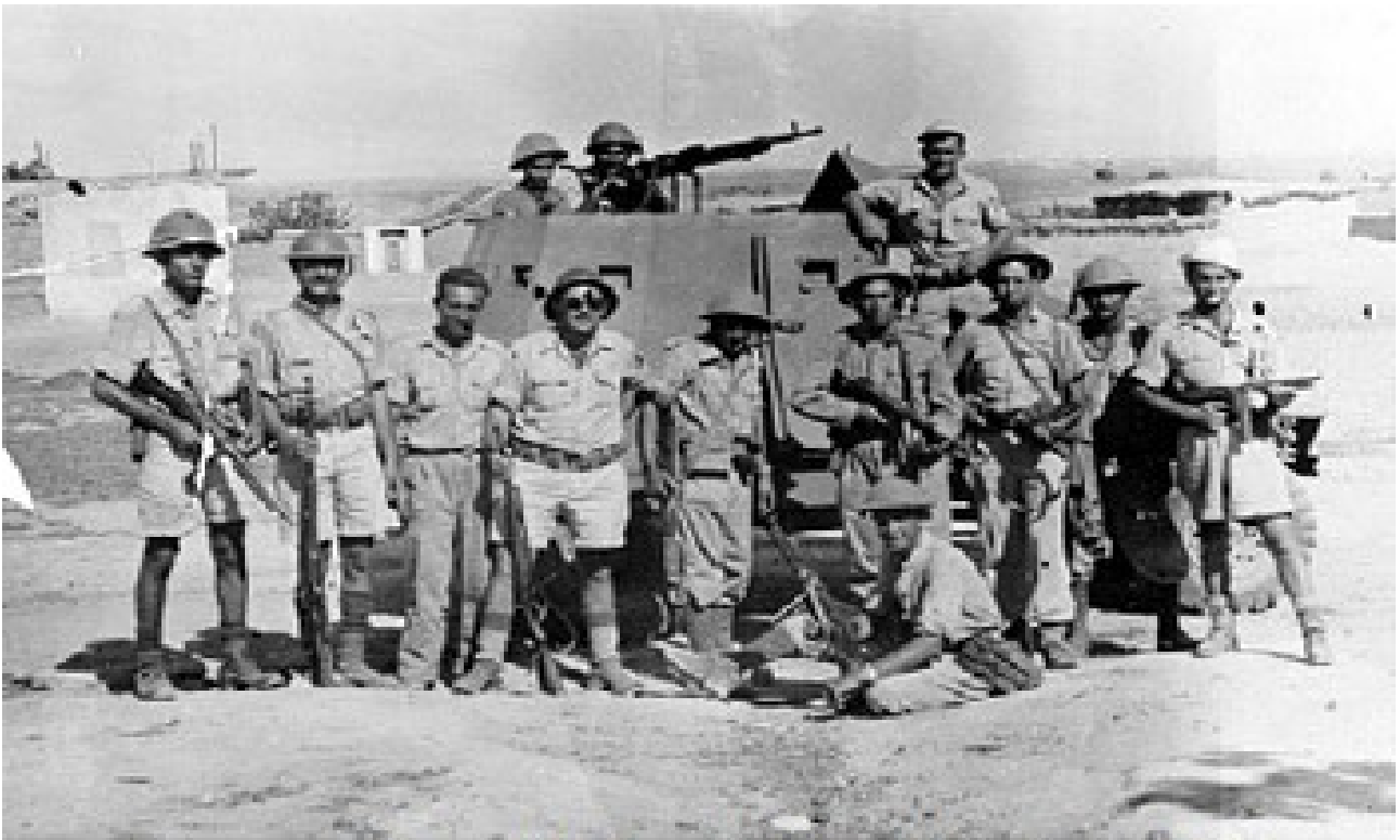
Some members of the Israeli Givati Brigade in 1948.

Israelin laskuvarjojoukot ryntäsivät Länsimuurille, jonne yksikään juutalainen ei ollut päässyt 18 vuoteen. Rabbi Shlomo Goren, IDF:n päärabbi (ja myöhemmin Israelin päärabbi) ryntäsi muurille, puhalsi shofariin ja ilmoitti: "Olemme vallanneet Jumalan kaupungin. Olemme astumassa juutalaisen kansan messiaaniseen aikaan." Hän ymmärsi heprealaisten kirjoitusten profetioista, että kun juutalaiset ovat palanneet maahan ja takaisin pääkaupunkiinsa, Messias tulee.