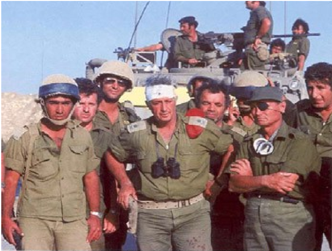
Israeli troops in the Sinai during the Yom Kippur War. Standing in the middle with the head bandage is General Ariel Sharon. Next to him, with the eye patch, is Moshe Dayan who was serving as Minister of Defense at the time.

Lokakuun 15. päivään mennessä Egyptin panssarioukot oli tuhottu ja Sharon oli ylittänyt Suezin kanavan. Hän piiritti nopeasti Egyptin kolmannen armeijan, teki sen toimintakyvyttömäksi ja alkoi marssia kohti Kairoa.