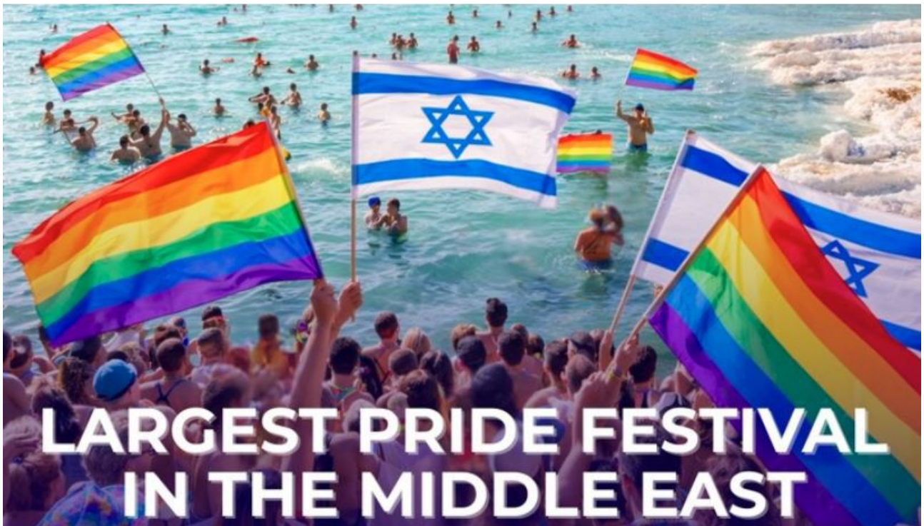
LGBTQ festival announcement at the Dead Sea.