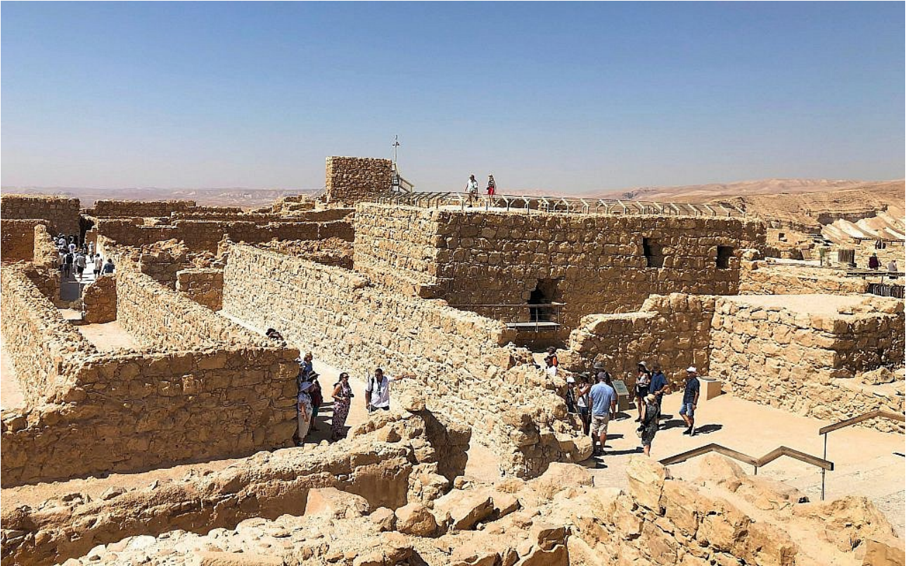
Turistit sekoittuvat Masadassa 11. heinäkuuta 2019.

valtavia kustannuksia, koska heidät ja heidän eläimensä on varustettava”, hän sanoi.