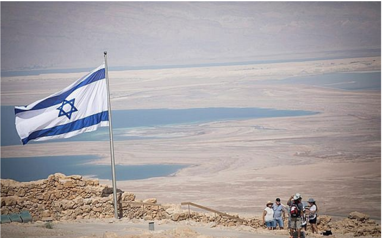
Ihmiset kiertävät Masada-vuorta, lähellä Kuollutta merta Etelä-Israelissa, 19. heinäkuuta 2018.

”Masada-narratiivista, juutalaisten suuresta kapinasta, piirityksestä ja traagisesta lopusta Flavius Josefuksen kertomana on kaikista tullut osa Israelin DNA:ta ja siionistista eetosta... Piirityksen kesto on tärkeä elementti tässä tarinassa, mikä viittaa siihen, että Rooman loistava armeija huomasi hyvin vaikeaksi vallata linnoitus ja murskata sen puolustajat”, hän toteaa tutkimuksesta laaditussa lausunnossaan.