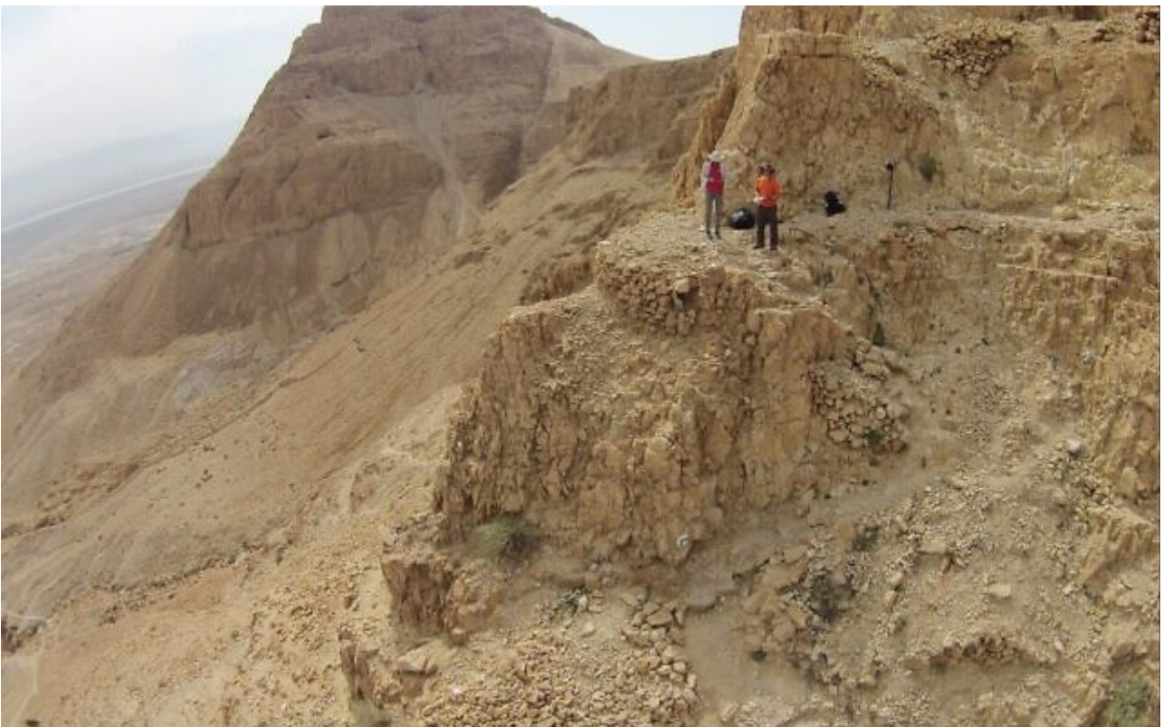
Masadan kansallispuisto.

”Sensijaan, että se olisi ollut vain yritys tuhota viimeinen juutalaisen vastarinnan tasku Rooman hallinnolle, yksi tärkeimmistä syistä oli taloudellinen, Stiebel sanoo. Meidän on kysyttävä, mitä tapahtuu yhtäkkiä kolme vuotta Jerusalemin kukistumisen jälkeen, että he yhtäkkiä muistaisivat Masadan?”