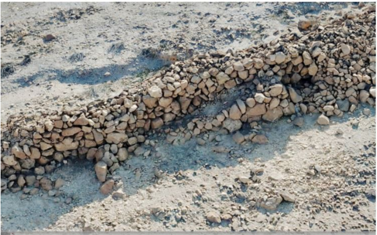
3D-malli roomalaisten Masadaan tunkeutumiseen käyttämästä rampista/portaasta lounaasta katsottuna.

Vertailemalla roomalaisten linnoitusten tilavuutta ja rakennetta huolellisesti laadittuihin inhimillisen työmäärän laskelmiin tutkijat päättelivät, että roomalaiset rakensivat Masadan ympärille piirityslinnoitukset vain 11-16 päivässä ja pystyivät murtautumaan linnoitukseen kohta sen jälkeen.