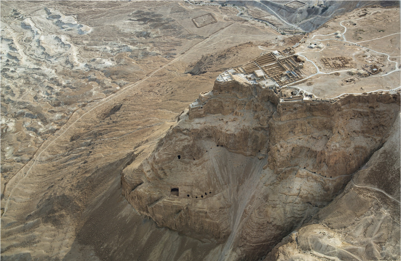
Pääkuva: Ilmakuva historiallisesta Masadan linnoituksesta lähellä Kuollutta merta, 3. joulukuuta 2021.