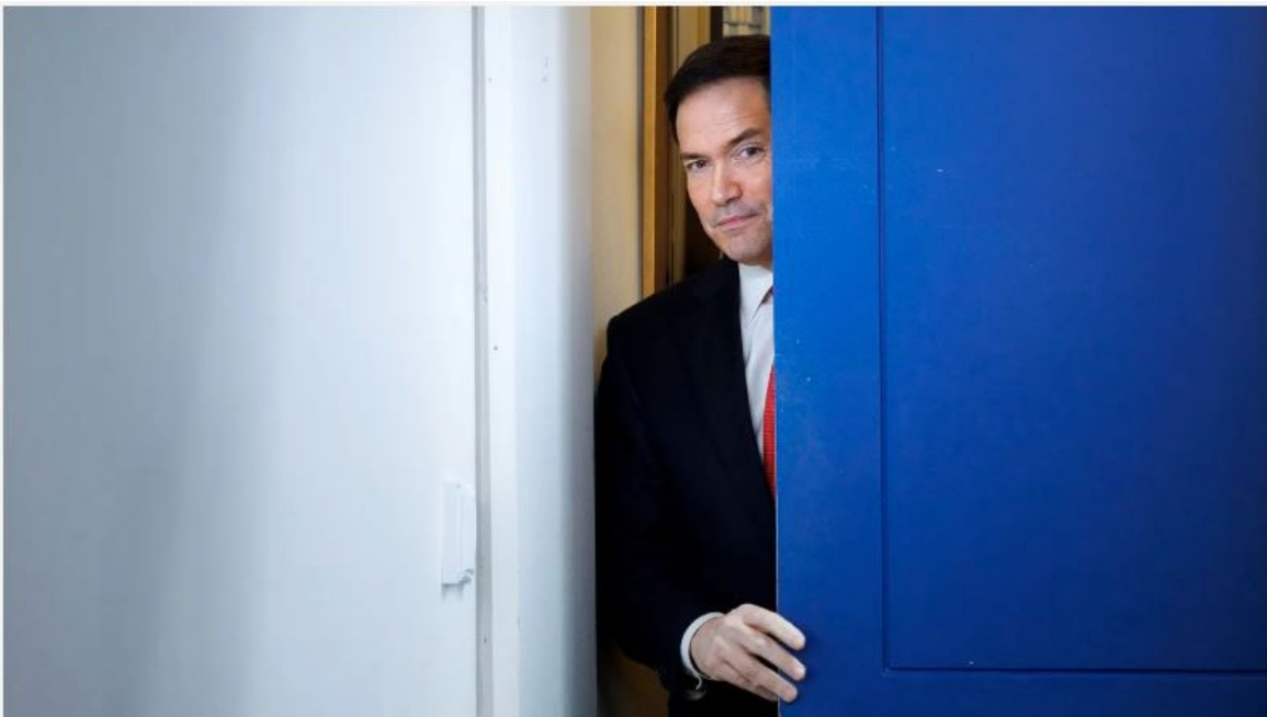
Ulkoministeri Marco Rubio

Yhdysvaltain ulkoministeri Marco Rubio toisti tämän näkemyksen ja antoi tunnustusta Trump'in "visiolle ja rohkeudelle" sellaisen saavuttamisessa, jota monet pitivät "mahdottomana". Erityislähettiläs Steve Witkoff ja muut ovat puhuneet palautetuista panttivangeista, palautetusta toivosta ja mahdollisuudesta soveltaa vapaiden markkinoiden periaatteita, jotta gazalaisille annetaan ihmisarvo ja tilaisuus loputtoman apuriippuvuuden ja jatkuvan sodan asemesta.