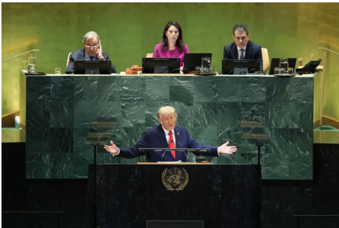
Presidentti Trump puhuu YK:ssa

Toisin sanoen Trump on vallassa, jos haluaa, koko elämänsä ajan ja hän nimittää itse seuraajansa. Kyseessä ei selvästikään ole tyypillinen monenvälinen elin, jossa on kiertävä johto tai ainakin näennäinen tasavertaisten osapuolten välinen valvonta. Se on puheenjohtajan johtama yksikkö ruorissa Trump, jolla on laaja harkintavalta.