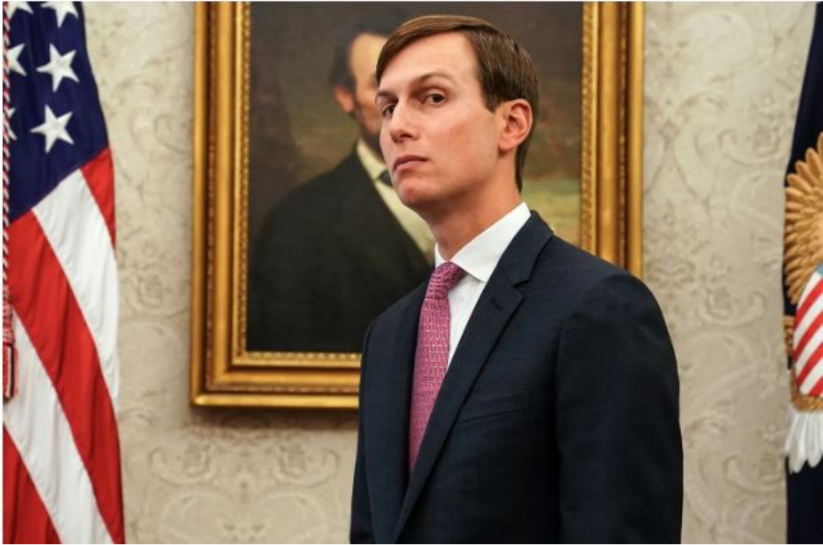
Presidentti Trump'in vävy, Jared Kushner

Myös YK:n omat "rauhanrakennustoimet" ovat usein edistäneet korruptiota ja länsimaiden vastaisia ideologioita. Amerikkalaisilla on oikeus tietää, etteivät heidän verorahansa mene jälleen uuden "globaalin hallinnon" välineen tai tason rahoittamiseen.