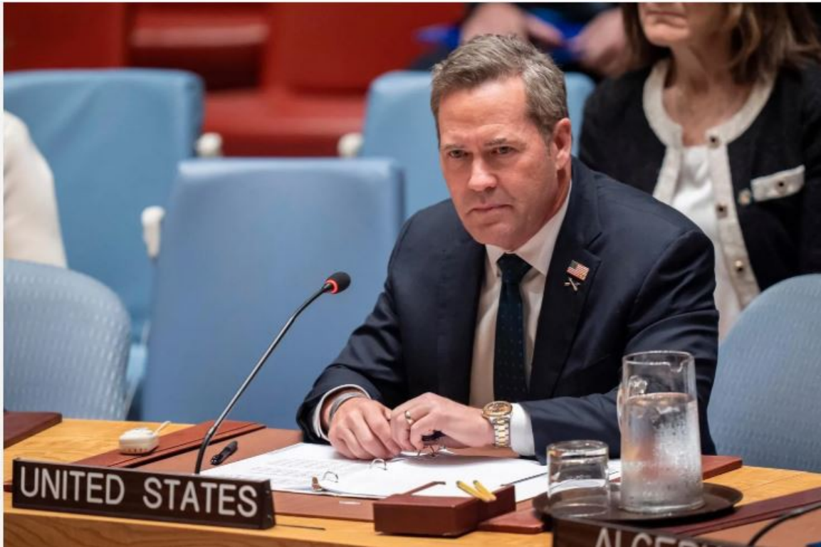
Mike Waltz, Yhdysvaltain edustaja YK:ssa

YK perustettiin tietenkin alusta alkaen toimimaan tulevana maailmanhallituksena. Jopa keskeiset yhdysvaltalaiset virkamiehet, kuten ulkoministeri John Foster Dulles, myönsivät tämän tuolloin (ks. hänen kirjansa War or Peace ). Toinen prosessiin osallistunut amerikkalainen avainhenkilö, Alger Hiss, joka johti YK:n perustanutta konferenssia ja toimi sen ensimmäisenä johtajana, oli joukkomurhia tehneen Neuvostoliiton tyrannin Josif Stalin'in vakooja.