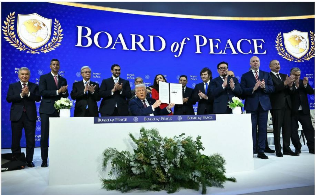
President Trump's launch of the Board of Peace at the World Economic Forum

Uuden voimakkaan globaalin järjestön, "Rauhanneuvoston", esiinmarssin myötä amerikkalaiset ja ihmiset kaikkialla esittävät suuria kysymyksiä.