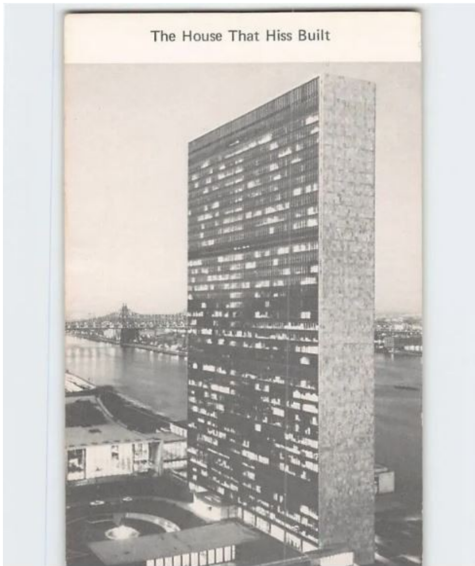
YK:n päämaja, New York

paljon sortoa ja surkeutta ympäri maailmaa.