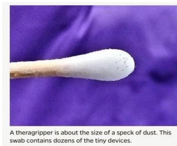
Kuva 2: Theragripper'eitä vanupuikossa

Huomautus: Johns Hopkins -yliopiston mukaan Theragripper'it annetaan itse asiassa vanupuikolla. (ks. kuva 2)