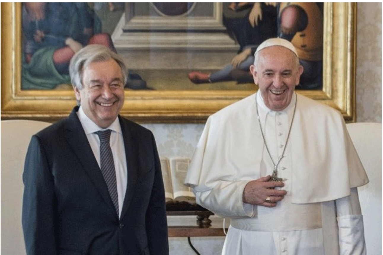
Fransiskus & Guterres – “yhden maailman” kumppanit

Etteivät olisi pekkaa pahempia YK: n pääsihteeri Antonio Guterres ja paavi Fransiskus työskentelevät rinta rinnan ajaen tätä globalistista agenda. Guterres on Portugalin entinen pääministeri ja maansa sosialistisen puolueen pääsihteeri vuodesta 1992 vuoteen 2002. Vuosina 1999-2005 hän palveli sosialistisen internationaalien presidenttinä, voimakkaan globalistisen verkoston, joka edustaa äärivasemmistolaisia yksilöitä ja organisaatioita, joiden tiedetään edistävän radikaaleja marxilaisia näkemyksiä ja menettelytapoja kansakuntien keskuudessa.