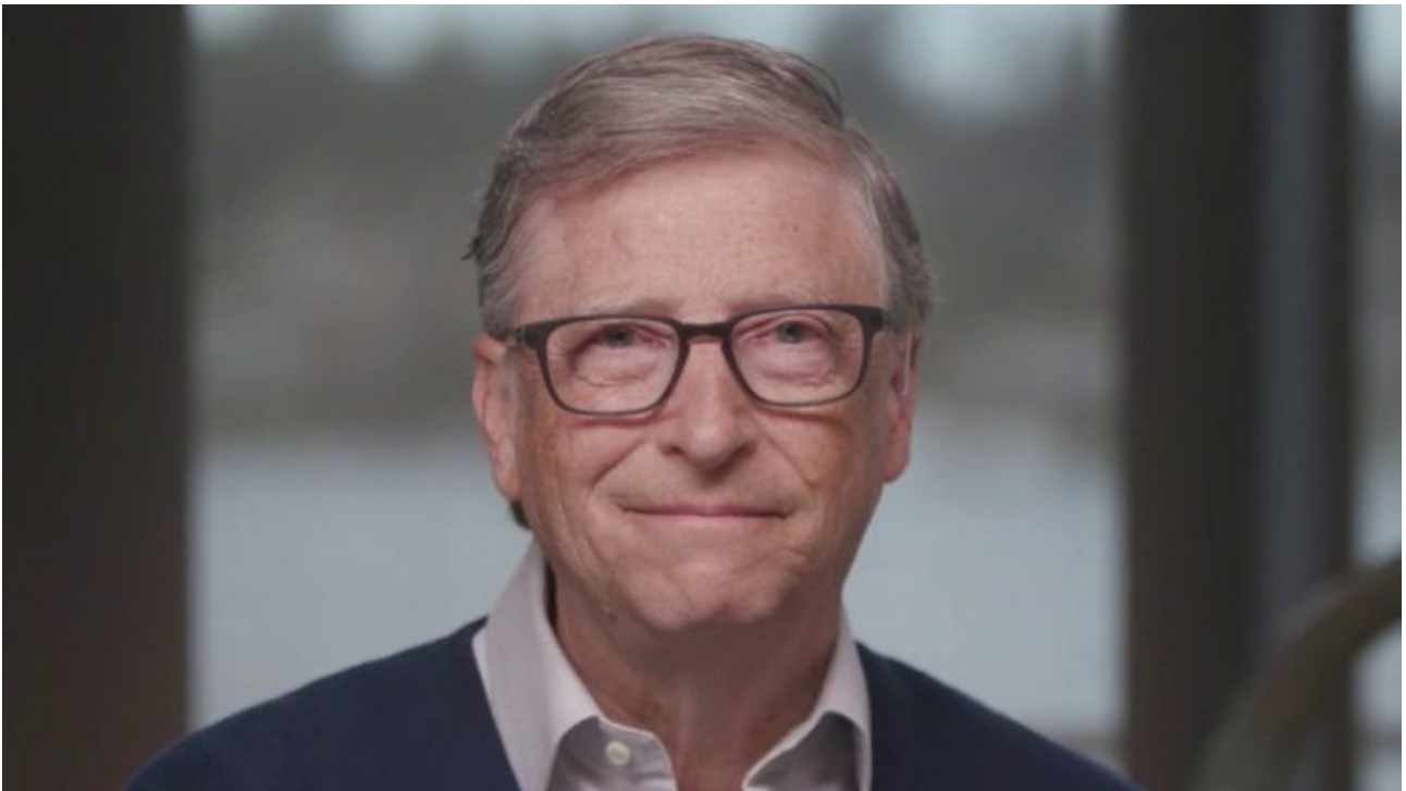
Bill Gates, hi-tech -globalisti