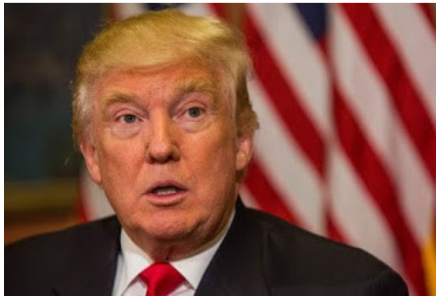
Onko tässä Antikristuksen kasvot? Vastavalittu presidentti Donald Trump

”Raamatun mukaan, Antikristus tulee olemaan karismaattinen julkkis, 'suurusu' ja 'lipevä puhuja”, verkkosivulla todetaan. ”Hän vakuuttaa ihmisille, että yksin hänellä on ratkaisu jokaiseen ongelmaan. Hän väittää olevansa sovinnontekijä (deal-maker) ja mestarineuvottelija.”