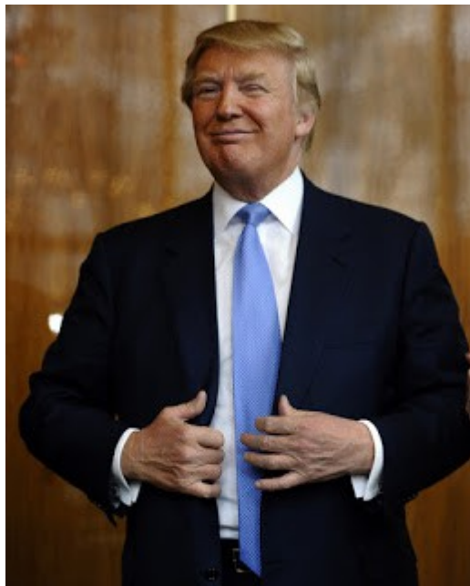
Tämä ilme Trumpilla sen jälkeen, kun hän nappasi presidenttiyden yllätysvoitossa tiistaina

Se lisää: ”Hän korottaa itsensä ja väittää olevansa 'ainoa Pelastaja'. Hän eksyttää massat, ja jopa valitutkin. Kuulostaako joltakin, jonka tunnet?”