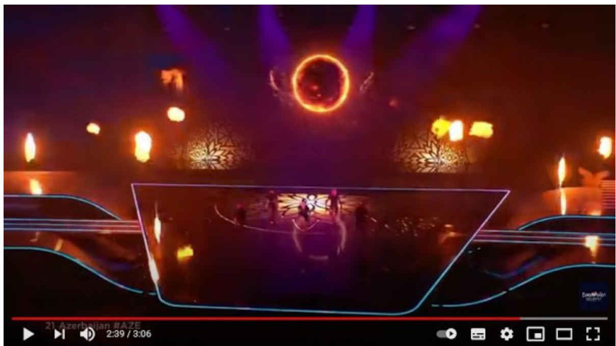
Efendi - Mata Hari - LIVE - Azerbaijan | | | - Grand Final - Eurovision 2021

Toiseksi Espanjan esitys, jossa ensin nähdään täydellinen auringonpimennys ja myöhemmin täysikuu ilmassa. Katso https://www.youtube.com/watch?v=thV-vhOQHvQ