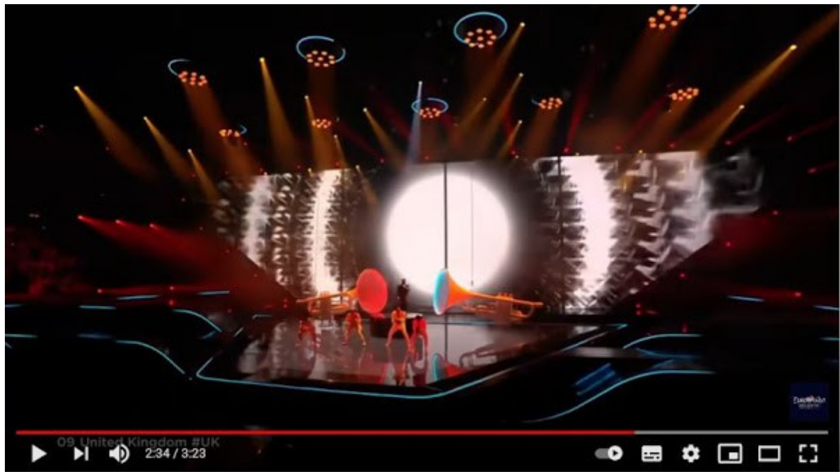
James Newman - Embers - LIVE - United Kingdom GB - Grand Final - Eurovision 2021

Tällainen taivaan merkkien määrä ei ole tavallista tässä laulukilpailussa (tällaista ei ole koskaan ennen nähty). Siksi luulen, että Herra pani nämä taivaankappalemerkit esille juuri nyt, jotta tietäisimme mitä aikaa elämme (Jumalan tuomio ja seurakunnan ylösotto on lähellä). Raamatussa 1. Moos. 1:14 jakeessa sanotaan: ”Ja Jumala sanoi: ”Tulkoot valot taivaanvahuuteen erottamaan päivää yöstä, ja olkoot ne merkkeinä osoittamassa aikoja, päiviä ja vuosia, ” Sitten Luukkaan evankeliumissa Jeesus sanoo paluunsa merkeistä: ”Ja on oleva merkit auringossa ja kuussa ja tähdissä, ja ahdistus kansoilla maan päällä ja epätoivo, kun meri ja aallot pauhaavat. ” (Luuk. 21:25) Profeetta Joel ja Apostolien teot kertovat myöskin Herran päivää edeltävistä taivaan merkeistä: ” Aurinko muuttuu pimeydeksi ja kuu vereksi, ennenkuin Herran päivä tulee, se suuri ja peljättävä. ” (Joel 2:31) sekä ” Aurinko muuttuu pimeydeksi ja kuu vereksi, ennenkuin Herran päivä tulee, se suuri ja julkinen. ” (Apt. 2:20)