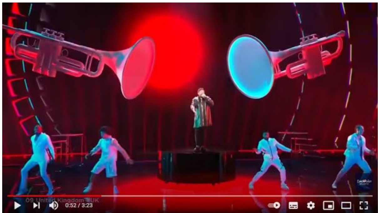
James Newman - Embers - LIVE - United Kingdom GB - Grand Final - Eurovision 2021