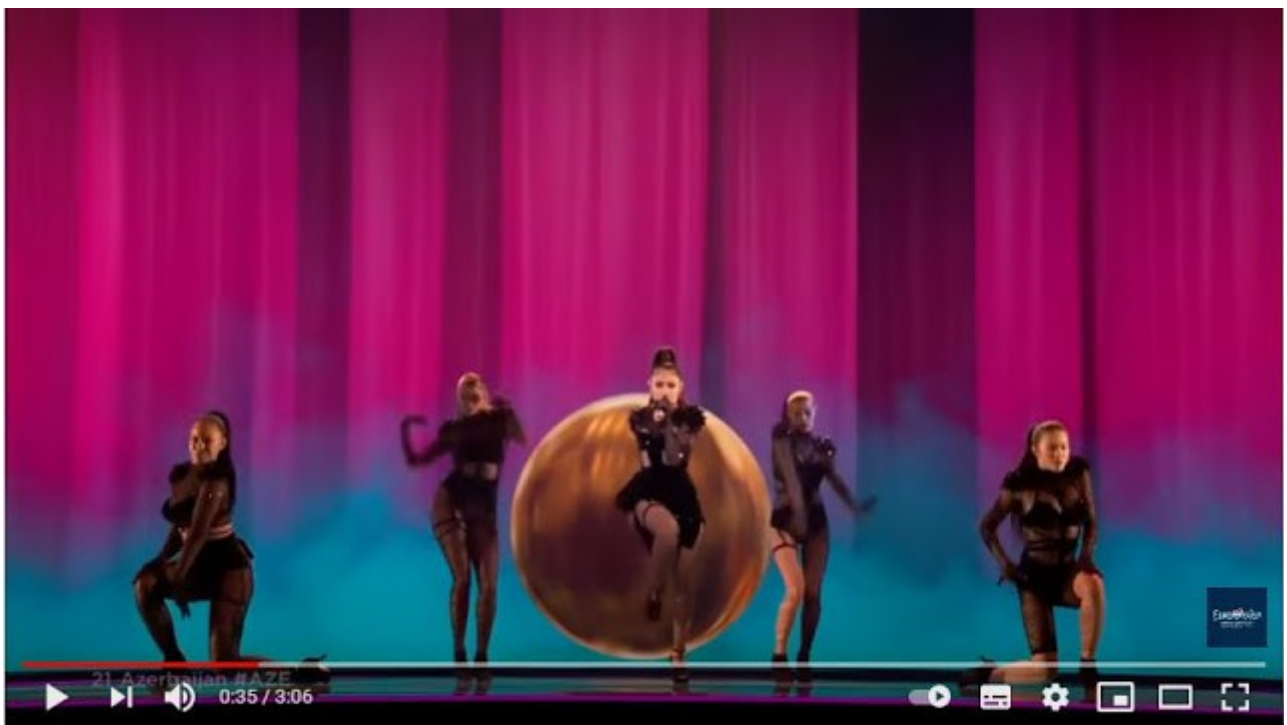
Efendi - Mata Hari - LIVE - Azerbaijan | | | - Grand Final - Eurovision 2021