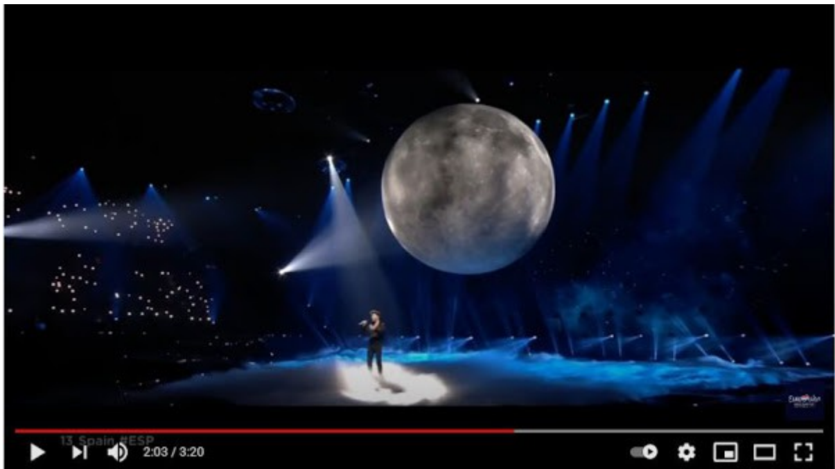
Blas Cantó - Voy A Quedarme - LIVE - Spain es - Grand Final - Eurovision 2021

Kolmanneksi Latvian laulu nimeltä " The Moon Is Rising (Kuu nousee) ". Nainen laulaa heti alussa, että " the blood moon is rising (verikuu nousee) ". Sitten hän asettaa kätensä pänsä päälle kuin muodostaen pirunsarvet (voi toki tarkoittaa muutakin). Katso https://www.youtube.com/watch?v=btA_Tyiyfhc