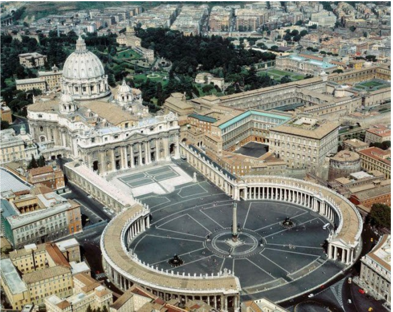
Pyhän Pietarin Kirkko ja Aukio Roomassa