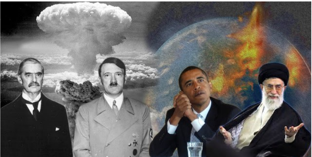
Neville Chamberlain & Adolf Hitler vs. Barack Hussein Obama & Ajatollah Ali Khamenei

http://www.raptureready.com/soap2/ward55.html