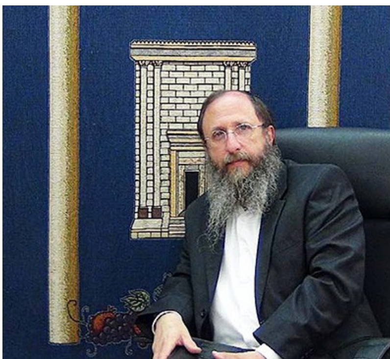
Rabbi Chaim Richman, Temppele-instituutin kansainvälinen johtaja.

Alttari on mitoiltaan yhdeksän kertaa yhdeksän jalkaa, korkeudeltaan viisi jalkaa ja se on valmistettu kevytbetonista. Sen on katsottu olevan sopiva käytettäväksi temppeleissä, kunnes pysyvämpi voidaan tehdä. Rabbi Baruch Kahane palveli ylipapin roolissa vihkimisseremoniassa, joka pidettiin vanhankaupungin länsimuurin vieressä lähellä Jaffa-porttia. Pappien asu oli tarkasti Raamatun mukaan sopiva Temppeleihin. Jerusalemin kunnalliset viranomaiset eivät sallineet lampaan tappamista paikan päällä, joten se teurastettiin toisessa paikassa ja osia lihasta poltettiin alttarilla. 4