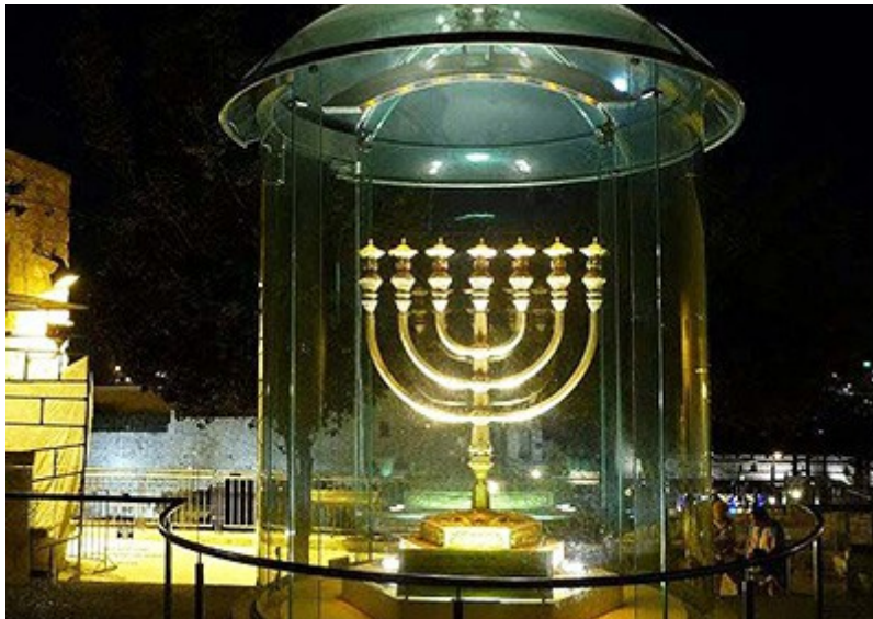
Kultainen menorah kolmatta temppeliä varten.

Kallein esine, jonka instituutti on rakentanut temppeliä varten, on kultainen menorah, joka sijoitetaan Pyhään. Se on päällystetty 95 kilolla puhdasta kultaa ja maksaa useita miljoonia dollareita. Se on tällä hetkellä esillä lasikotelossa paikassa, josta on näkymä Länsimuurille.