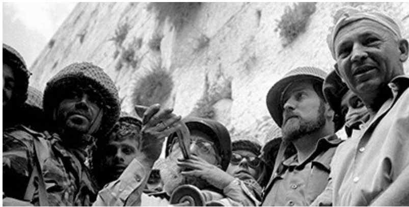
Rabbi Shlomo Goren puhaltaa sofariin Länsimuurilla kesäkuun 7. päivänä 1967.

Kun juutalaiset valloittivat Jerusalemin vanhankaupungin 7. kesäkuuta 1967, rabbi Shlomo Goren (IDF:n päärabbi ja myöhemmin Israelin johtava askenaasien päärabbi) ryntäsi länsimuurille, puhalsi shofarin ja huusi: "Olemme vallanneet Jumalan kaupungin. Olemme tulossa juutalaisen kansan messiaaniseen aikakauteen." 22 Hän sanoi, että koska hän tiesi heprealaisten kirjoitusten profetioista, että kun juutalaiset ovat jälleen maassansa ja pääkaupungissansa, Messias tulee.