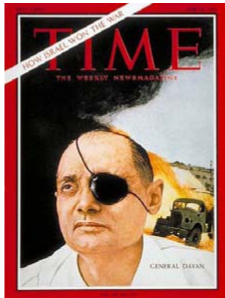
Moshe Dayan (June 16, 1967)

Temppelivuoren hallinnan ongelma syntyi vuonna 1967, kun juutalaiset valloittivat Jerusalemin vanhan kaupungin kuuden päivän sodassa. Sen sijaan, että vaatisi suvereniteettia, kuten muille osille vanhaa kaupunkia, Israelin puolustusministeri Moshe Dayan, joka oli maallinen juutalainen, päätti omavaltaisesti antaa temppelivuoren valvonnan takaisin muslimeille toivoen sen todistavan Israelin halua rauhaan. Sen sijaan se viestitti muslimeille, että juutalaiset olivat heikkoja päättäväisyydessään valvoa muinaista pääkaupunkia. Siitä lähtien muslimit ovat kieltäneet juutalaisilta tasavertaiset oikeudet Temppelivuorella.