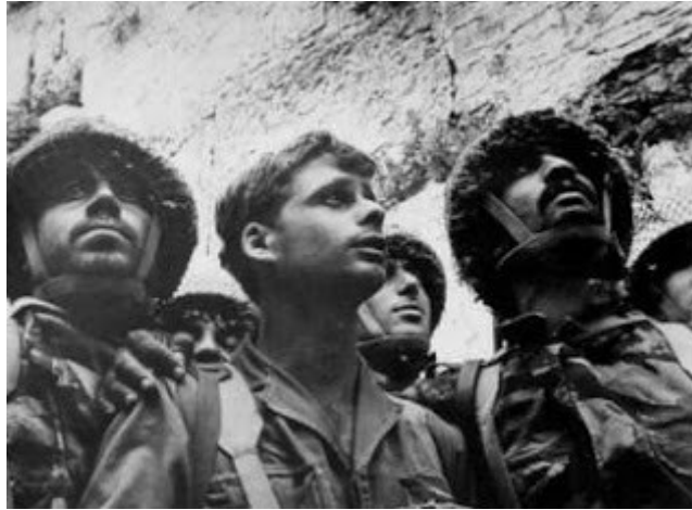
Israelilaisia sotilaita länsimuurilla 7.6.1967

PM Netanyahu lainaa Raamatun profetioita Jerusalem-päivänä 5.6.2016 puhuessaan Jerusalemin jakamattomuudesta ja Riemuvuosi -suunnitelmasta! – Suuri enemmistö demokraattipuolueen äänestäjistä kannattaa Hillary Clintonin pyrkimistä edelleen presidentiksi, vaikka hän olisi syytettynä rikoksesta!