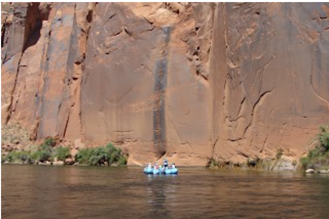
Pystysuoria kallioseinämiä kaikkialla Grand Canyon'issa

Toinen esimerkki on Suuren Kanjonin lähes pystysuorat kiinteät kallioseinät. Me teemme aina kesäkuussa Suuren Kanjonin luomismatkan ja osoitamme tieteelliset todisteet , jotka tukevat sitä, että ne muodostuivat nopeasti päivien tai viikkojen sisällä. (Liity joukkoomme tänä vuonna – tilasimme juuri toisen bussin...kesäkuun 22-25. päivät... tilaa meno- ja paluulento Phoenix'iin)