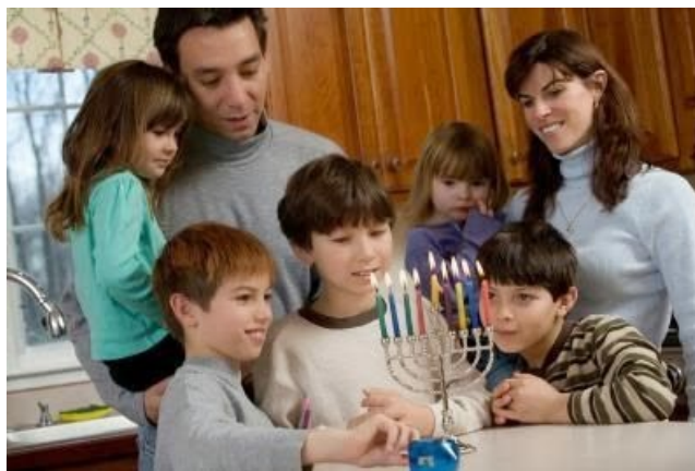
Gallupit osoittavat, että suurin osa juutalaisista ei luota Obamaan. Daa!

Israel oli valmis poistamaan Iranin ydinlaitokset joitakin vuosia sitten, mutta Obaman hallinto julkisti suunnitelman ja uhkasi ampua alas jokaisen israelilaisen Iranin ydinlaitoksia vastaan hyökkäävän israelilaisen ilma-aluksen. Obama on osoittanut inhoavansa Israelia.