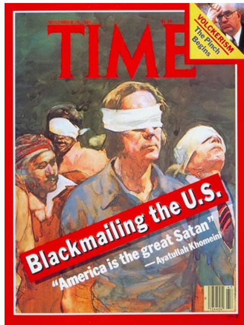
Siepattuja amerikkalaisia panttivankeja vuoden 1979 Time -lehden kannessa.

Iranilla , joka on Raamatun Persia , vaikka ei olekaan arabimaa, on muslimivaikutuksesta johtuen viime aikoina ollut järjettömien ja aggressiivisten tekojen historia. Siitä saakka, kun Amerikan tukema Shaahi syrjäytettiin vuonna 1979 ja korvattiin Ajatollah Khomeini'n johtamalla Islamilaisella Tasavallalla, heidän käytöksensä on syvästi vakiintunut.