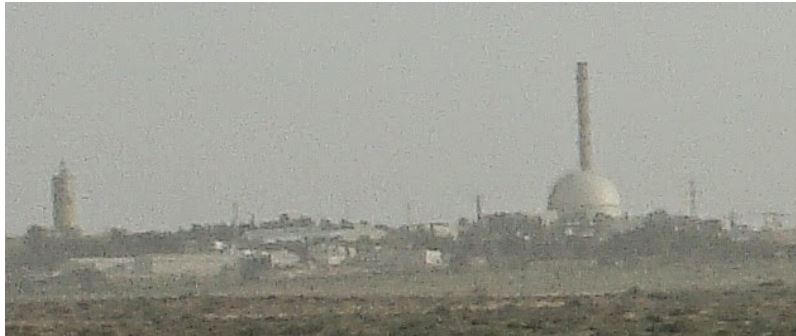
Israelin ydinlaitos – nähtynä yli kolmen kilometrin päästä.

On yleisesti tiedossa, että Israelilla on ydinaseita. Se on tarpeeksi viisas, ettei myönnä sitä julkisesti, mutta heillä on ollut iso pommi yli 30 vuotta. Olen itse nähnyt Israelin ydinlaitoksen etäältä.