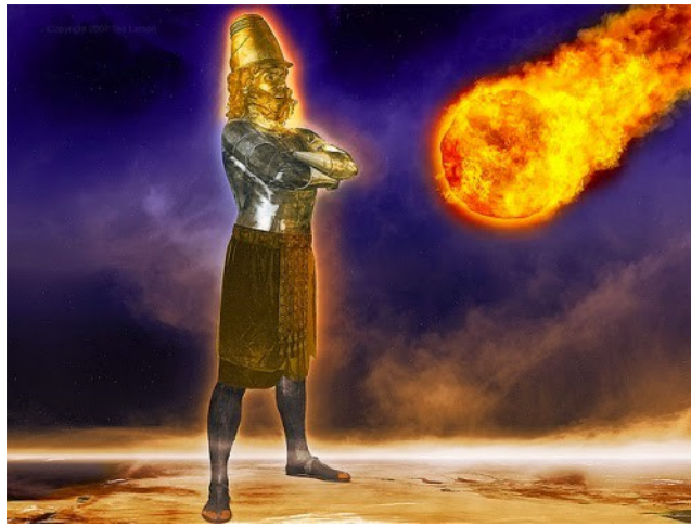
Profetia on olennainen osa Raamattua tarjoten lohtua lohduttomassa maailmassa

Silti monet seurakunnat ovat lopettaneet tai lopettamassa Raamatun profetian opettamisen. Useimmat ns. megaseurakunnat ohittavat profeettalliset kirjoitukset osittain tai kokonaan, mikä tietysti tarkoittaa, että he karttavat noin 25% osuutta Raamatusta!