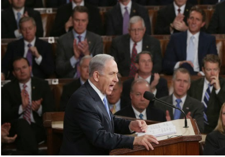
Netanyahu USA:n kongressin edessä maaliskuussa 2015

Hallintomme Lähi-Idän käsittely on kuin ottaisi kattilallisen vettä ja laittaisi sen kiehumaan kuutosella ja toivoisi, että hämmäntäminen estää sitä kiehumasta yli. Jumalattomalla johdolla on yleensä jumalattomat teot. Omena ei putoa kauas puusta.