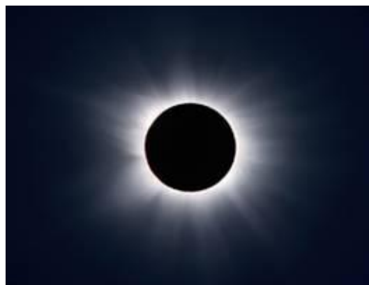
ja aurinko meni mustaksi niinkuin karvainen säkkipuku,.