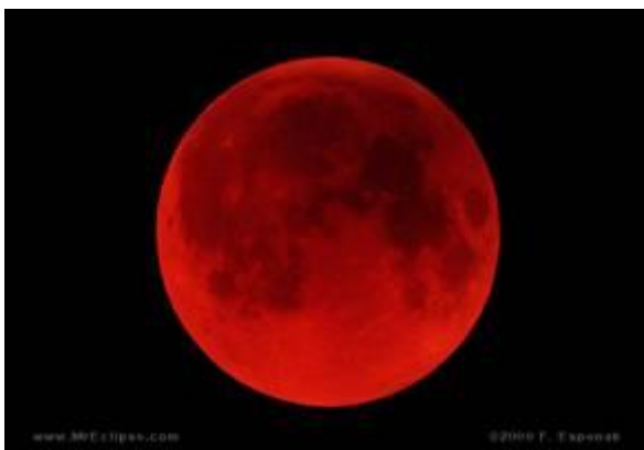
ja kuu muuttui kokonaan kuin vereksi..