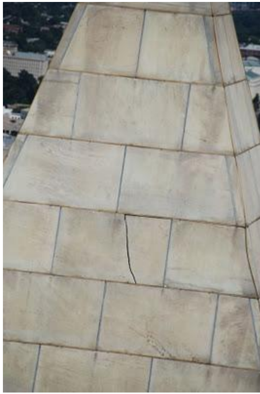
A one-inch wide, four-foot long crack was spotted Wednesday in the Washington Monument's pyramid, near the very top of the 555-foot obelisk.

[Virginian maanjärjestys saattoi johtua kahdesta maanalaisesta ydinräjähdyksestä, joissa kuoli joidenkin arvioiden mukaan yli 60,000 USA:n armeijan sotilasta. Tämä olisi ollut NWO-vastainen isku, jonka takana oli estää maailmanlaajuinen holokausti jonka nämä Uuden Maailmanjärjestyksen illuminaatit olisivat saaneet aikaan ydinpomme-iskuillaan Länsimaissa ja muualla. Venäjän pääministeri Vladimir Putin olisi kuulemma saanut vihiä asiasta ja ryhtynyt toimenpiteisiin. Uskoo ken haluaa, mutta NWO-pyramidin huippukiveä muistuttavan obeliskin huippukohdan särö saattaisi olla vinkki tällaiseen (särö suunnitelmaan). Lue enemmän http://nwohavainoja.blogspot.com/2011/09/ydinpommi-isku-usan-armeijan-bunkkeriin.html . Suom. huom.]