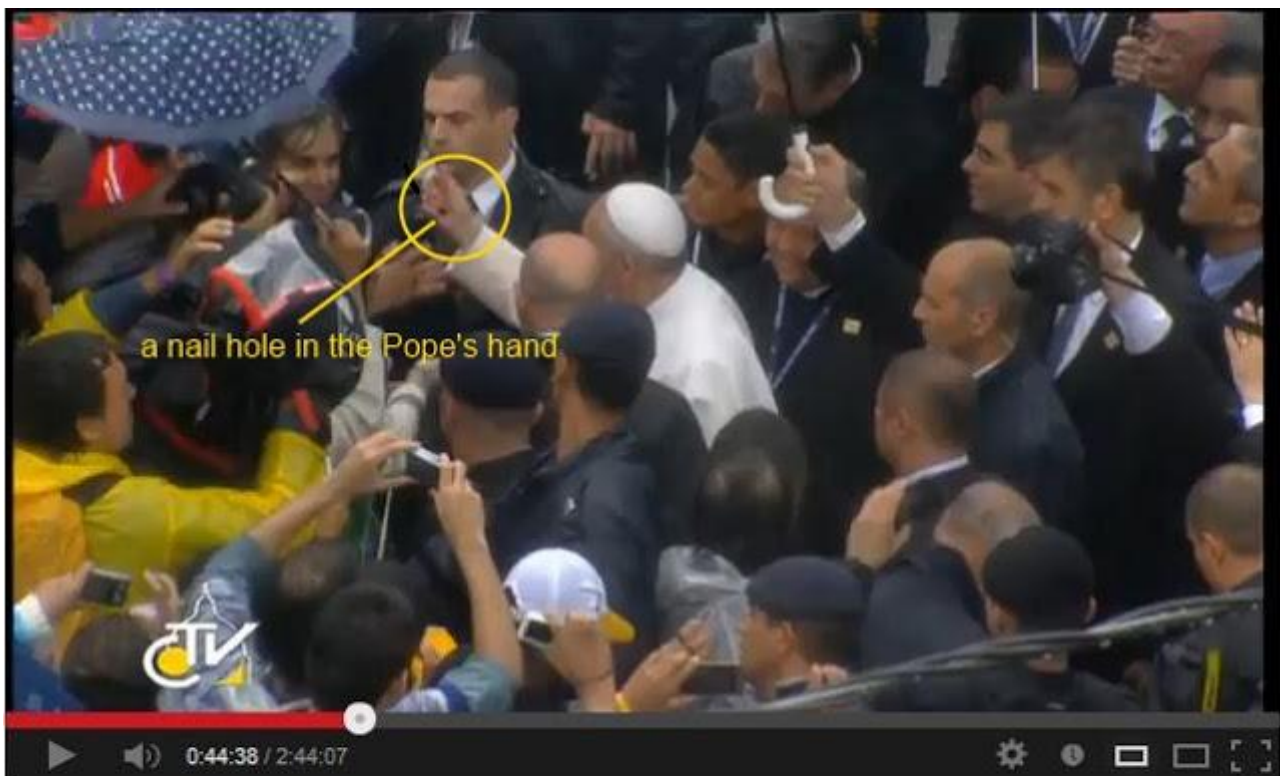
The Pope at Rio - Visit to the Varginha Community

Eräs tarkkaavainen lukija ilmoitti minulle mielenkiintoisesta havainnosta eilen blogini vieraskirjassa. Hän kehotti katsomaan videota Paavi Franciscuksen vierailusta Brasiliassa viime viikonloppuna (Paavin ensimmäinen ulkomaanmatka) jossa Paavi kätelee ihmisiä ja yhtäkkiä hänen käteensä ilmestyy merkki, tai stigma , kuvaten Kristuksen haavaa eli veristä naulanjälkeä. Merkki hävisi melko nopeasti Paavin kädestä (näkyi ehkä pari sekuntia). Onko kyseessä aito yliluonnollinen ilmiö jää lukijoiden arvioitavaksi, mutta esitän kuitenkin pysäytyskuvan tuosta videon kohdasta jossa näkyy " pedonmerkki " Paavin OIKEASSA KÄDESSÄ. Onko Paavi Franciscus, Ilmestyskirjan Väärä Profeetta eli 2. Peto (Ilm. 13:11-), näin aloittanut oman NWO-agendansa josta stigma on merkinä? Jotkut väittävät että demonit aikaansaavat stigmatisaation.