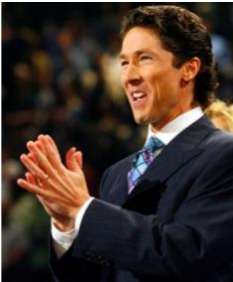
Joel Osteen ja Rick Warren ovat SUURIA elokuvan Son of God mainostajia

Esimerkiksi elokuvassa Jeesus tunkee kutsumatta Pietarin veneeseen Gennesaretinjärven ulapalla (joka ei mitenkään muistuta todellista Gennesaretinjärveä).