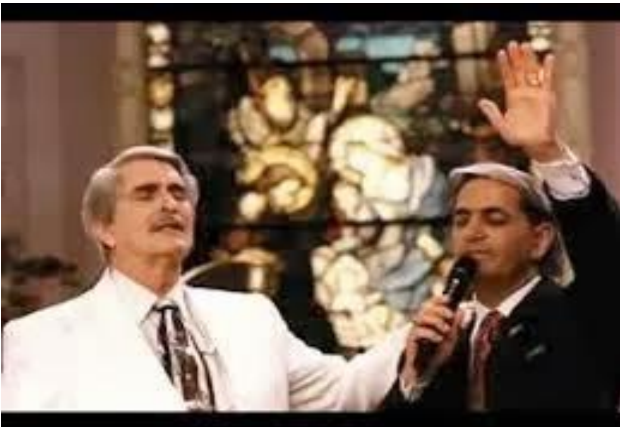
Paul Crouch ja Benny Hinn