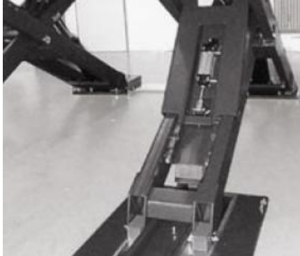
Mekaaniset lukot pyörien-suuntaukseen. (Hymax X PH A / Plus A)