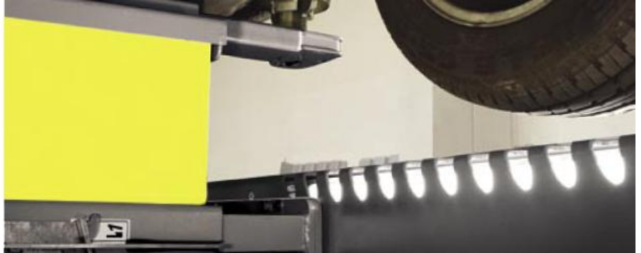
Hymax X -nostimet voidaan varustaa myös akselisto-keventimellä ja ajosiltoihin integroiduilla valaisimilla