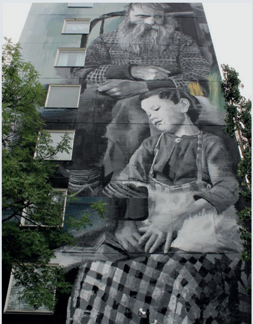
Wasp Elder (2017)

Brittiläinen taiteilija Wasp Elder (s. 1986) huomioi paikallisuuden tehdesään nimettömäksi jäänyttä seinämaalustaan. Hän hyödynsi teoksessaan vanhaa suomalaista, Eino Mäkisen ottaa valokuvaa. Elderistä on sanottu, että hän pohdiskelee ihmisyiden eri puolia ja haluaa usein nostaa esiin inhimillisyyden ja yhteisöllisyyden teemoja. Turun teoksessa Elder käsittelee sukupolvien välistä harmoniaa ja nykyihmisen suhdetta historiaansa. Teoksen synnyinajankohta on 22.9.2017, ja se on osa UPEA17 -festivaalia.