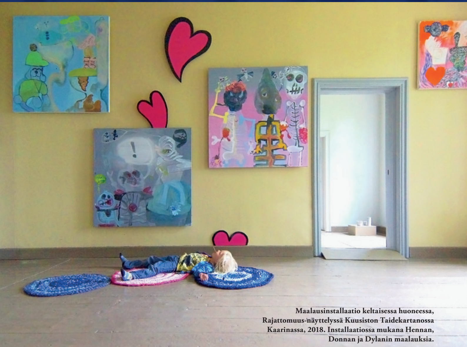
Maalausinstallaatio keltaisessa huoneessa, Rajattomuus-näyttelyssä Kuusiston Taidekartanossa Kaarinassa, 2018. Installaatiossa mukana Hennan, Donnan ja Dylanin maalauksia.