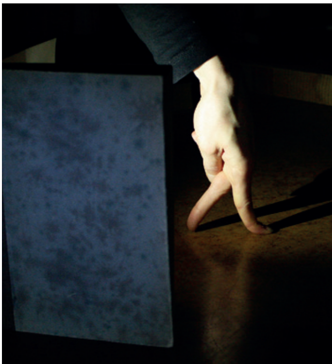
Sirkus Supiaisen residenssi, syksy 2017

Tätä kirjoitan synnyinseuduillani Rovaniemellä. Esiinnyin kahdella eri esityksellä täällä paikallisen Sirkus Taika-Ajan 15-vuotissyntymäpäivillä. Sen jälkeen on suunta kohti kotia ja jatkamaan SenseS-esityksen tekemistä. Aika mahtavaa on tämä ihmisen elo!