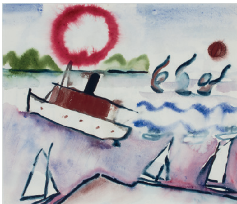
Greta Hällfors-Sipilä, 1919, Turun uimaseura pelaa vesipoolaa , akvarelli, 23 x 27 cm.