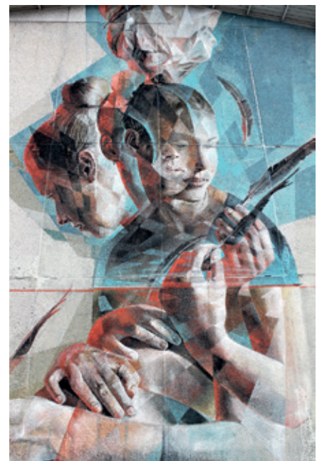
Vesod (2017), osia teoksesta