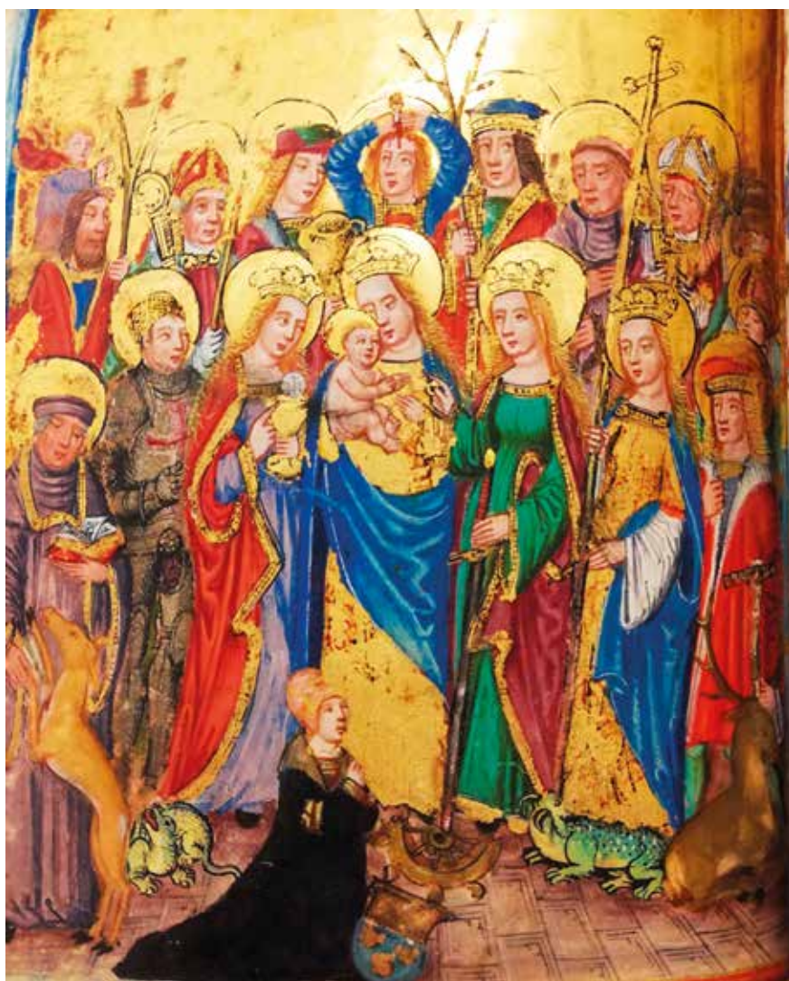
Neljätoista hädässäauttajapyhää Neitsyt Marian ja Jeesus-lapsen kanssa. Katariina Aleksandrialainen Marian oikealla puolella ja tämän vieressä Margareeta Aleksandrialainen. Kirjakuvitusta vuodelta 1509 Saksasta.