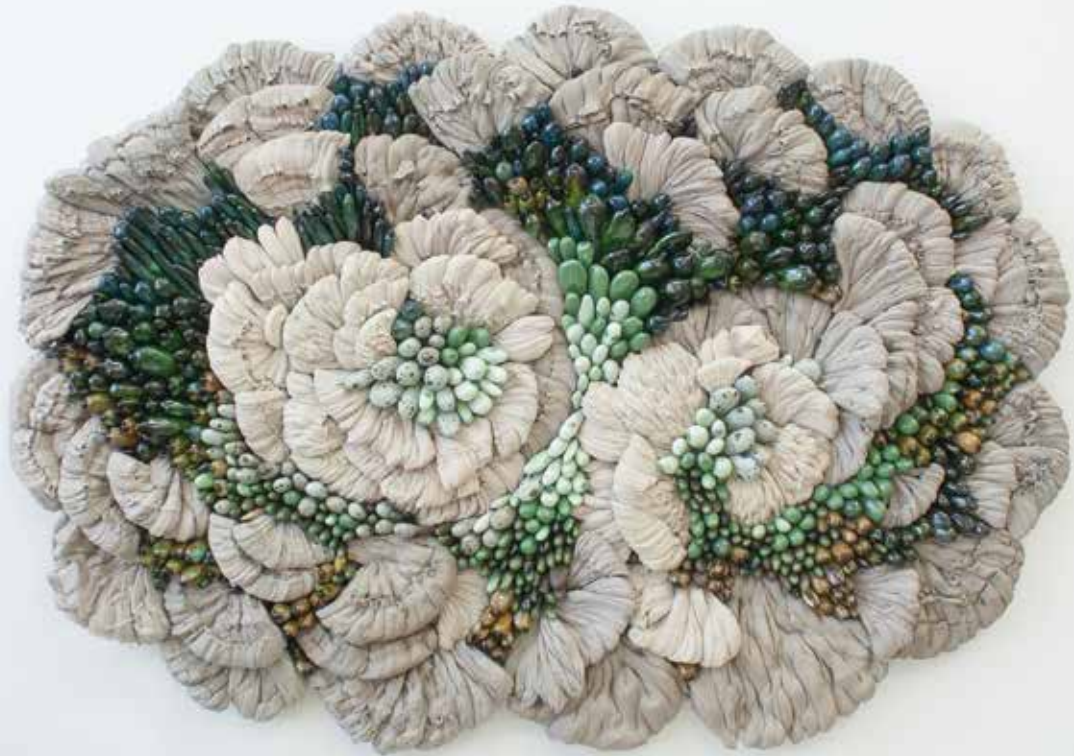
Jäkälä, 2019, Matias Liimatainen 115 x 80 x 15cm, keramiikka

Hyvissä Käsissä -näyttelyä varten toteutin keraamisia seinärelieffeoksia. Kiinnostuin erityisesti kudottujen verhoilukankaiden näytetilkuista ja niiden rakenteista. Uusissa teoksissani tekstiilin rakenne ja pintastruktuuri on muuttunut pienten keramiikka- ja lasiosien rytmittäväksi kolmiulotteiseksi pinnaksi.