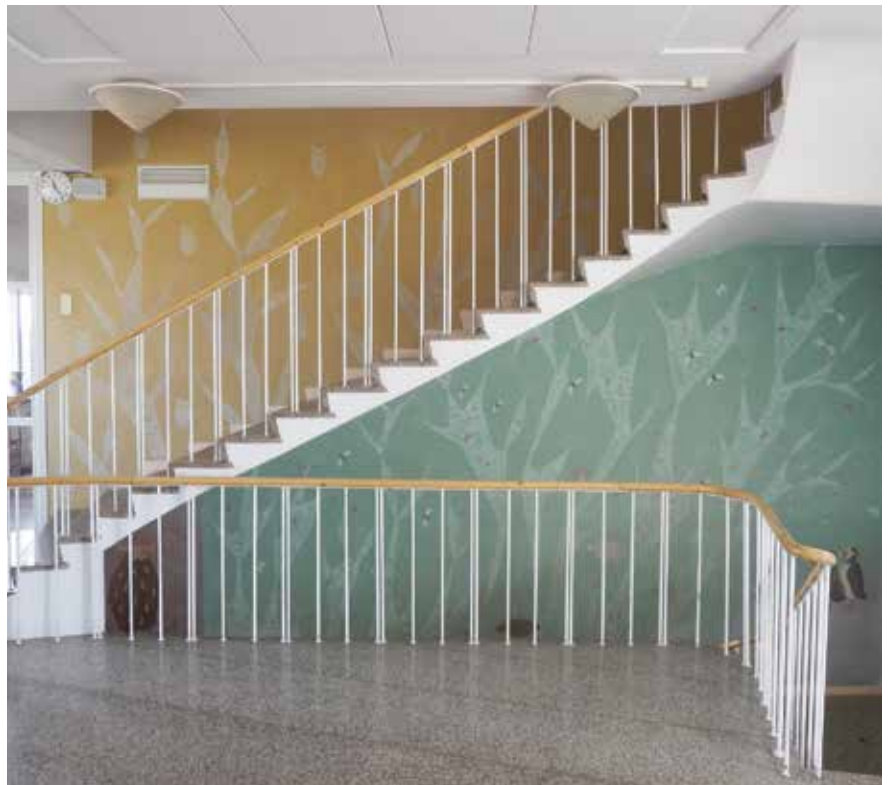
Eino Kaurian kookas seinämaalaus on syöplynyt tuhansien koululaisten tajuntaan. Tiukkailmeinen pöllö valvoo rappujen alapäässä. Funkishenkiseen rakennukseen on lisätty myöhemmin uutta tekniikkaa.

Kappelimäen koulussa ja päiväkodeissa on oltu tyytyväisiä näihin kohteisiin saatuun taiteeseen. Tilojen käyttäjät on tärkeää pitää mukana koko prosessin ajan. Taiteen hankinnasta on saatu julkisuuteen myös paljon kaivattua myönteistä kerrottavaa kaupungista. ■