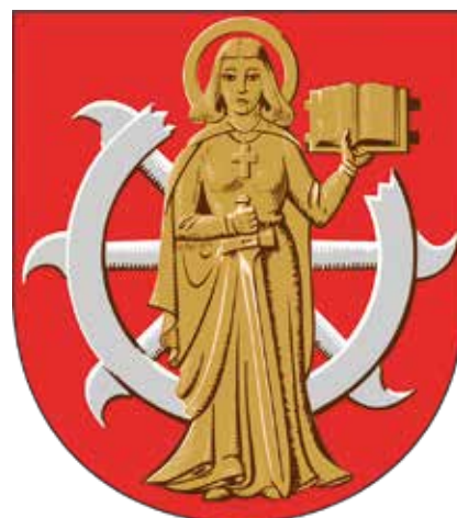
Kaarinan vanha kuntavaakuna (vuoteen 2008), Ahti Hammar 1955.