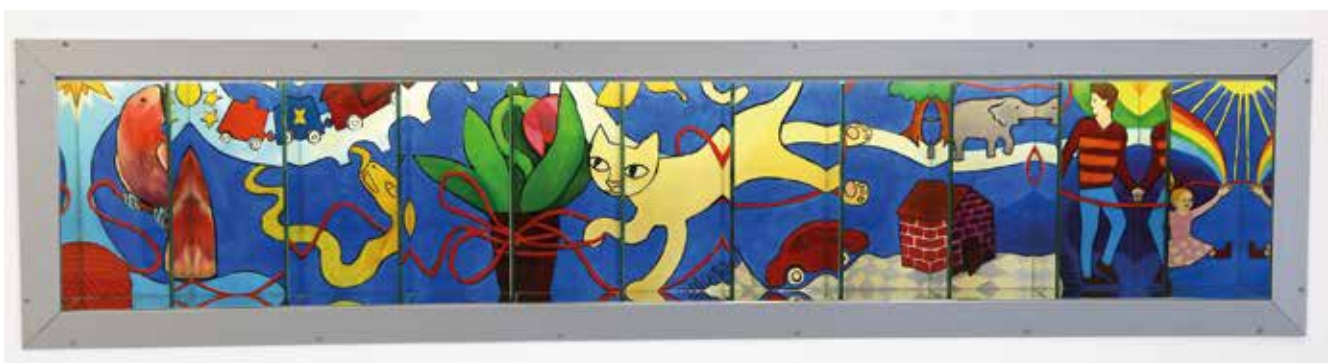
Emma Rönnholm: Punainen lanka 2020