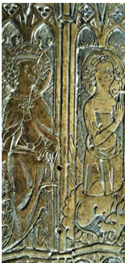
Pyhä Katariina Aleksandrialainen (vas.) ja Pyhä Margareeta Antiokialainen kuvattuna Nousiaisten kirkon Pyhän Henrikin sarkofagin kansilevyssä.

N ousiaisten kirkossa sijaitseva Pyhän Henrikin sarkofagi on Suomen keskiajan taiteen merkittävimpiä teoksia, sekä ainoa laatuaan Euroopassa. Sen teetti Turun piispa Maunu Tavast (piispana 1412-1449) Pyhän Henrikin reliikkiä säilytyspaikaksi ja muistoalttariksi 1410-luvun lopulla tai 1420-luvulla, tyylipiirteiden perusteella todennäköisesti Bruggen seudulla Flanderissa. Sarkofagia peittävät messinkiset kuvalaatat, joista sivuilla olevat esittelevät marttyyripiispa Henrikin legendaa, elämää ja kuoleman jälkeisiä ihmetekoja. Kansilaatassa puolestaan on pääosassa surmaajaansa Lallia jalkoihinsa polkeva Pyhä Henrik sekä tämän eteen polvistunut sarkofagin lahjoittaja Maunu Tavast. Tutkimuksissa yleensä vähemmälle huomiolle ovat jääneet Pyhän Henrikin ympärillä kansilevyssä, pienissä portaalisyvennyksissä esiintyvät 12 pyhimystä. Ylimpänä Henrikin olkapäiden tasalla ovat apostolit Pietari, Paavali, Andreas ja Johannes, jotka kaikki on helppo tunnistaa attribuuteistaan. Seuraavina piispan lantion tasalla ovat katsojasta vasemmalla pohjoismaiset kuningaspyhimykset Eerik ja Olavi sekä oikealla Ruotsissa vaikuttaneet lähetyspiispat Eskil ja Sigfrid. Alimpana oikealla ovat ruotsalaiset naispyhimykset Birgitta Vadstenalainen ja Elin Skövdalainen. Vasemmalla Maunu Tavastin selän takaa löydämme tämä artikkelin keskiössä olevat varhaiskirkon neitsytmarttyyrit Katariina Aleksandrialaisen ja Margareeta Antiokialaisen