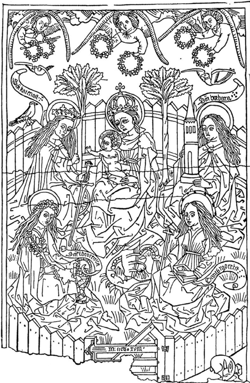
Virgo inter virgines, 1400-luvun belgialaisen puupiirroksen pohjalta tehty viivapiirros. Takarivissä vasemmalta Pyhä Katariina, Neitsyt Maria ja Jeesus-lapsi, Pyhä Barbara. Eturivissä vasemmalta Pyhä Dorothea ja Pyhä Margareeta.

Margareeta pääsi ulos. Lopulta Margareeta itse pyysi pyöveliä katkaisemaan kaulansa. Pyhän Margareetan tunnuksina taiteessa ovat yleensä lohikäärme ja ristisauva. Sekä Katariinan että Margareetan kuolemat on perinteisesti sijoitettu 300-luvun alkuun. Jo vuonna 494 paavi Pelagius piti Margareetan legenda epäilyttävänä, mutta ristiretkiäkin näiden molempien neitsytmarttyyrien kultti virkosi ja kukoisti läpi keskiajan.