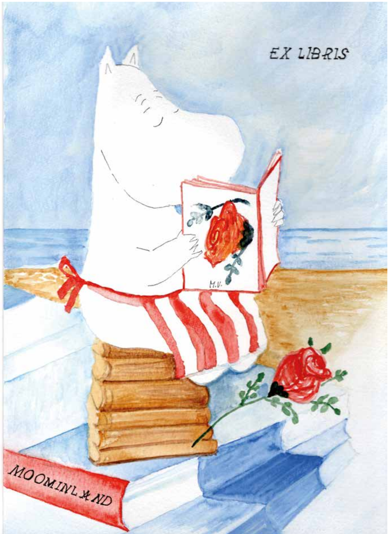
Veikkola Mirjami 2020, akvarelli, 296x210