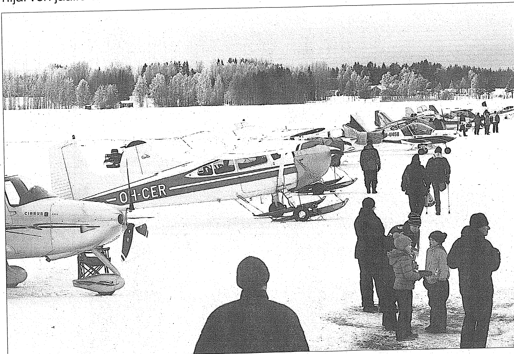
Kevytilmailu kiinnostaa yleisöä. Lentäjien talvinen suosikkitapahtuma keräsi jo lauantaina Nummijärven jäälle kevytlentokoneita eri puolilta Suomea.