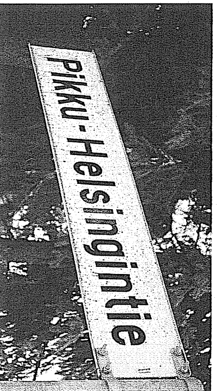
Samelinlaakson tie erkanee Pikku-Helsingintie.