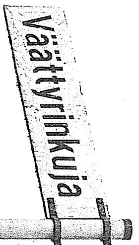
Väätyrinkuja on Hyppän Jokimäenkylässä.