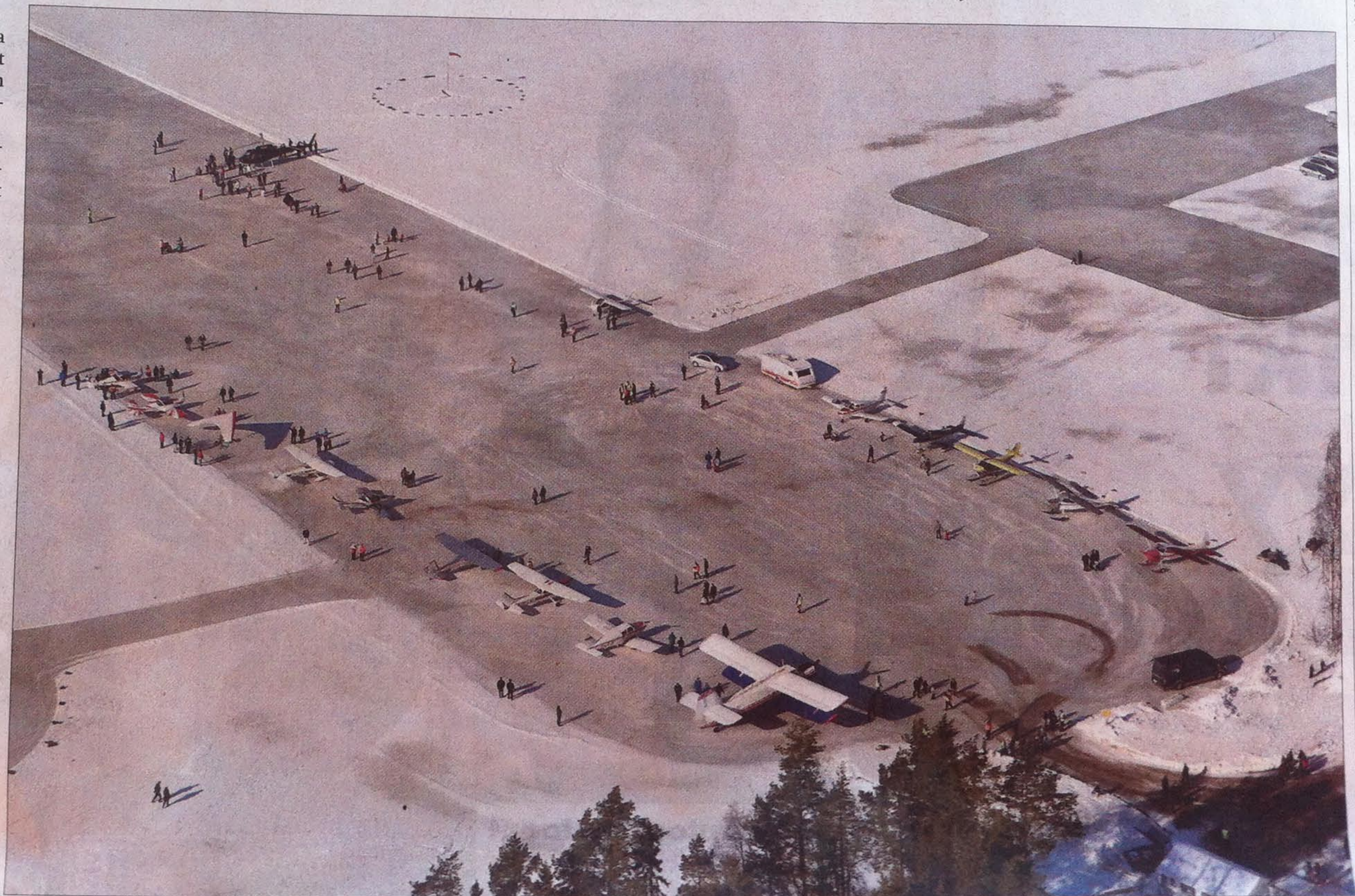
Harrastajalentäjät aloittivat kevätkauden jo 10. kerran Kauhajoen Nummijärven jäällä.

rikelkoilla ja aurattiin teräsjäälle, joka pidettiin sen jälkeen auki. Pitkä kokemus on osoittanut, että tuolloin jäätä muodostuu hieman kupera, ja mahdollinen vesi jää kentän laitamille, Nummijärvi tarkentaa.