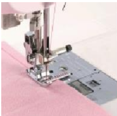
F063 Ompeleenohjausjalka punaisilla merkinnöillä, Asteikon avulla täydelliset tikkaukset A B C D E F G H J K L M N O