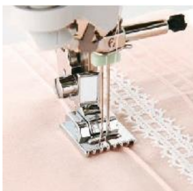
F059 Hiuslaskosjalka (7-urainen)+ puolakotelon kansi Hiuslaskosten ompelu kaksoisneulalla Innov-is 600/400/200