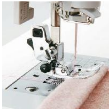
F053N Siksakjalka jousituksen lukitsimella Sis. kiinnitysvarren A B C D E F M N