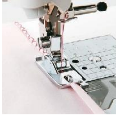
F029 Pykäärmäsjalka Pyällinen reuna ohuisiin kankaisiin