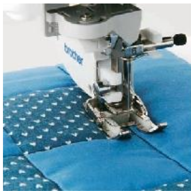
F062 Avoin yläsyöttäjä Neula-alueen hyvä näkyvyys. Vaikeasti ommeltaville materiaaleille. A B C D E F J K M N