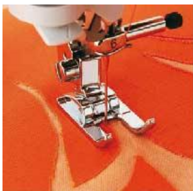
F060 Avoin paininjalka (metallinen) Neula-alueen hyvä näkyvyys A B C D E F G H J K L M N O