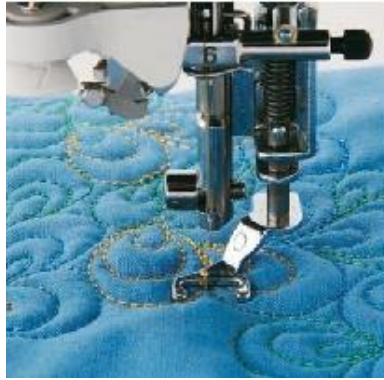
F061 Avoin vanutikkausjalka (metallinen) Neula-alueen hyvä näkyvyys. Käsivaraiseen brodeeraukseen A B C D E F G H M N O