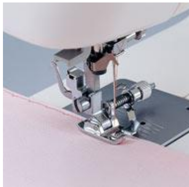
F018N Piilo-ommeljalka (metallinen säätöosa), Huomaa- mattomien päärmeiden ompeluun G H I L O P