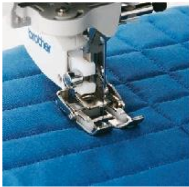
F050 Yläyöttäjä Vaikeasti ommeltaville materiaaleille I