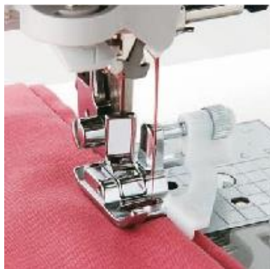
F017N Piilo-ommeljalka (muovinen säätöosa), Huomaa- mattomien päärmeiden ompeluun A B C D E F J K M N