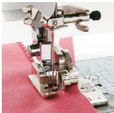
F054 Leikkuri Leikkaa kankaan reunan kuten saumuri A B C D E J