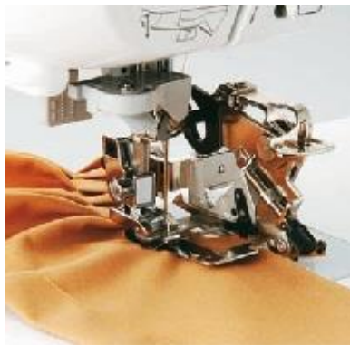
F051 Laskostusjalka (vain suoralle ompeleelle) Tasaisiin laskostuksiin ja poimutuksiin A F J K M