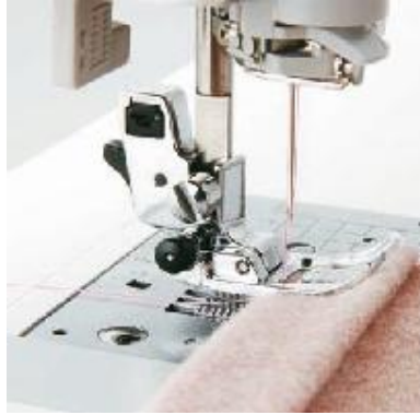
F052N Siksakjalka jousituksen lukitsimella Sis. kiinnitysvarren ja ruuvin J K