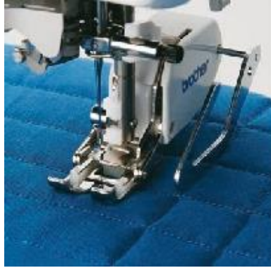
F016N Tikkausohjain Samansuuntaisten ompeleiden ompelu tasavälein KAIKKIIN KONEISIIN