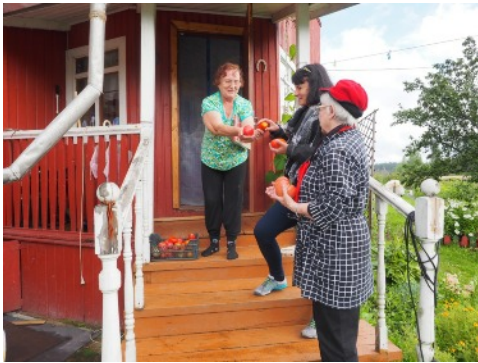
Töllin naapurin vieraanvaraisuutta

Matkamme jatkui tärkeään paikkaan...Tölliin...Mielen täytti sanoinkuvaamaton, epätodellinen tunne, tässä me nyt olemme. kolme aikuista naista, joista nämä kaksi olen tavannut juuri edeltävänä päivänä ensimmäistä kertaa ja kaikkien meidän yhteinen menneisyys lepää näissä hirsissä. Töllin tyttäret, Lämpimät kiitokset Teille, upeat naiset! Kallio, joka oli tien toisella puolella, oli siinä myös katselemassa menneitä sukupolvia, Vuoksi, joka virtasi alempana, virtasi myös tuolloin.