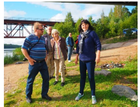
Retkeläiset Vuoksen rannalla