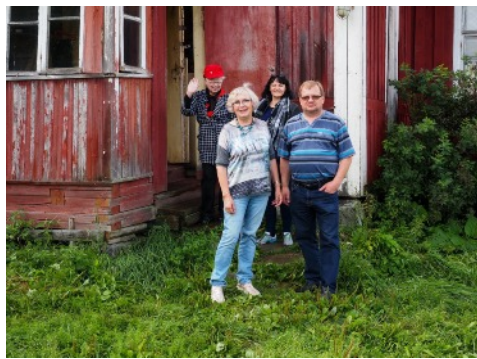
Töllin tyttäret ja Seppo talon edustalla