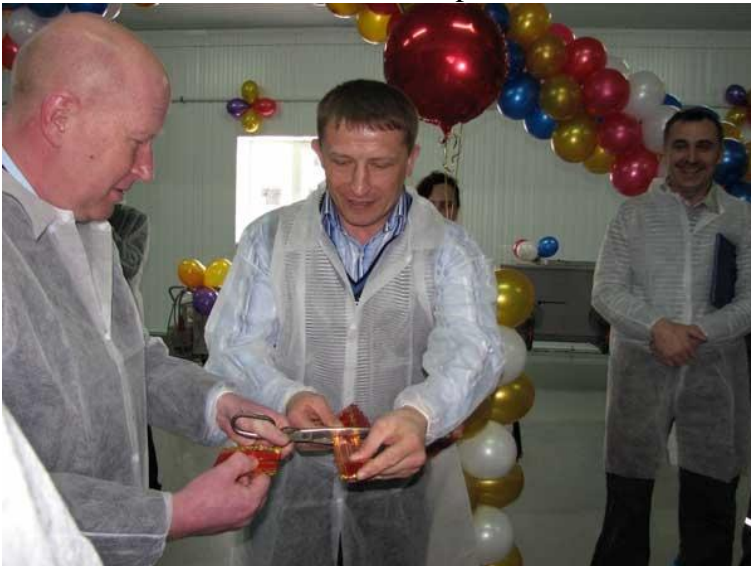
Otsanlahden Kala-Ranta laitoksen avajaiset

jonka lehtisali satoine koti- ja ulkomaisine aikakauslehtineen on todella paikka viihtyä. Silloin tällöin käymme Hgin teattereissa, joissa vaan on se pulma, että parhaiden kappaleiden lippujen jonotusaika nousee useihin kuukausiin. Emme taida tänä talvena lähteä Etelään viime kesä oli niin huikea!