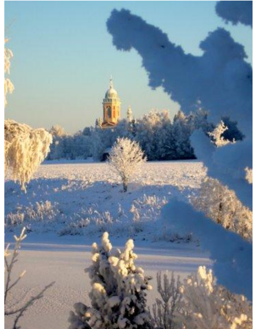
Loimaan kirkko talviasussa.