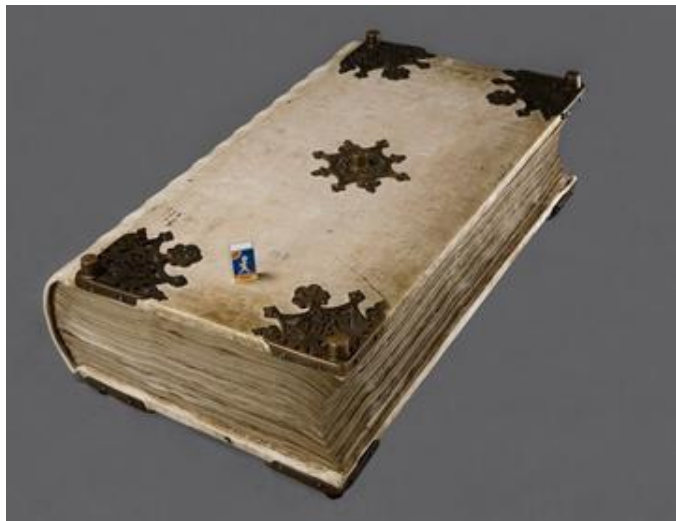
Paholaisen raamattu/Codex Gigas

Lopuksi ainakin osa meitä kävi tutustumassa aarre-kammiossa olevaan kirjaston suurimpaan käsikirjoi-tukseen, Paholaisen raamattuun. Kirjan mitoista saa kuvan kun vertaa sitä kannen päällä olevaan tulitik-kurasiaan. Kirja painaa 75 kiloa ja sen käsittelyyn tarvittiin neljä miestä. Voi sitojaparkaa!