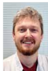
127 Anti Karhu Jyväskylä

Yleislääketieteen erikoislääkäri. Työpaikka Nokian sote-asema.