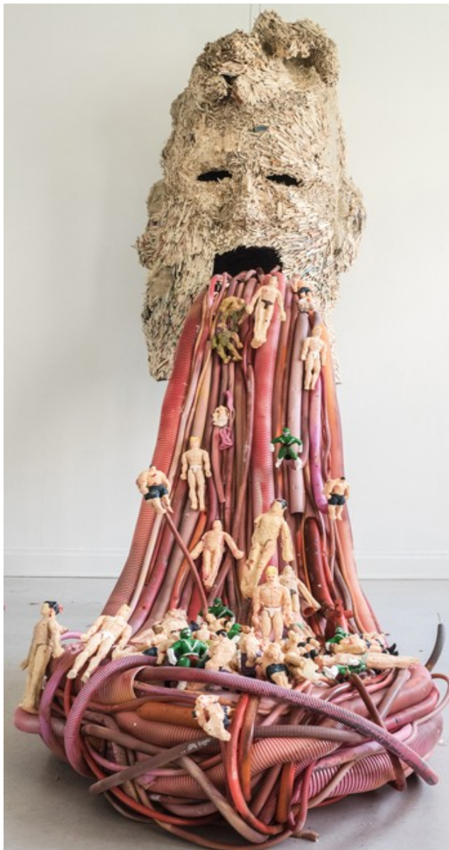
Aleksi Tolonen: Isä teki puusta