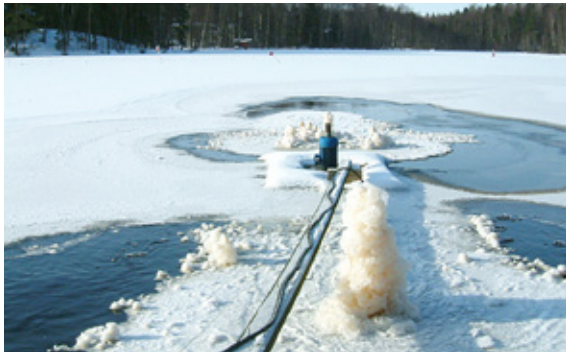
Ilmastin ei hapetin työssään

Viime vuosina ”roskakalat” on viety Korkeasaareen kuuteille.