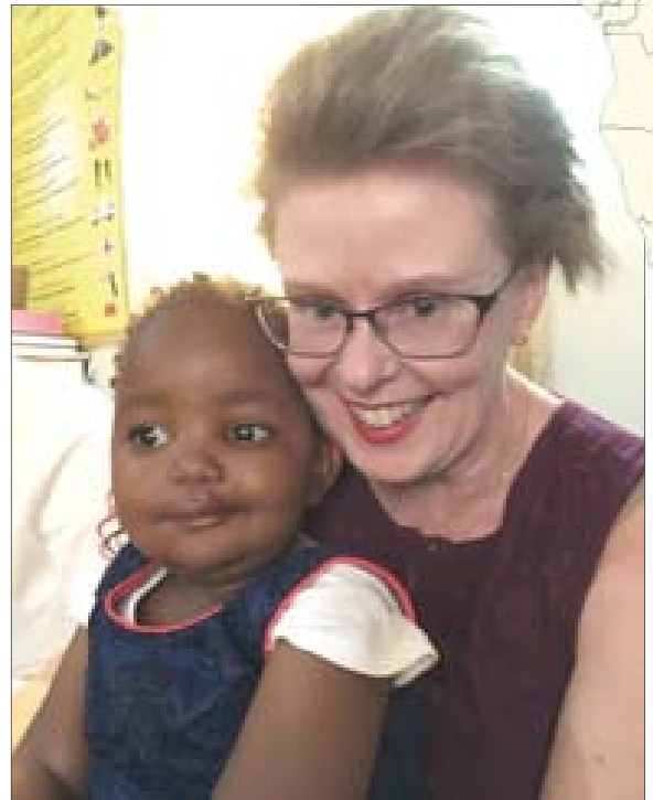
Langasin pyhäkoulutyttö halusi heti syliin. Harvinaista herkkua!

Saimme olla kolmessa sunnuntain kokouksessa mukana eri puolilla nandi-aluetta sekä rukouspäivillä. Toisen viikon olimme liikkeellä. Ensimmäisen kohteemme oli Korun Raamattukoulu. Tie ei ole koskaan ollut niin huono kuin nyt. Rankat sateet vievät tien maa-aineksen mensesään, ja jäljelle jää vain kivipelto. Ajoimme varoen laina-autolla. Oltiin pitänyt ehdottomasti olla nelive-