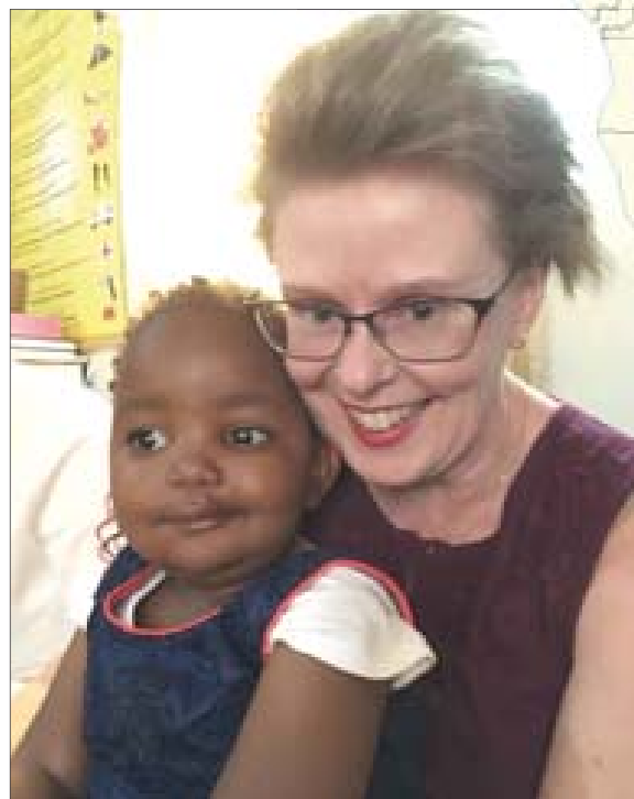
Langasin pyhäkoulutyttö halusi heti syliin. Harvinaista herkkua!

Saimme olla kolmessa sunnuntain kokouksessa mukana eri puolilla nandi-aluetta sekä rukouspäivillä. Toisen viikon olimme liikkeellä. Ensimmäisen kohteemme oli Korun Raamattukoulu. Tie ei ole koskaan ollut niin huono kuin nyt. Rankat sateet vievät tien maa-aineksen mensesään, ja jäljelle jää vain kivipelto. Ajoimme varoen laina-autolla. Oltiin pitänyt ehdottomasti olla nelive-