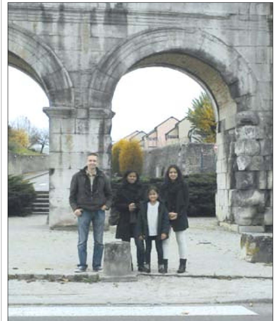
Haakanan perhe Autunin roomanaikaisella St Andreksen portilla

Olemme kiitolliset, että saamme palvella teidän kauttanne Ranskan kansaa ja lukuisia täällä asuvia et- nisiä ryhmiä llosanomalla Jeesuk- sesta! ■