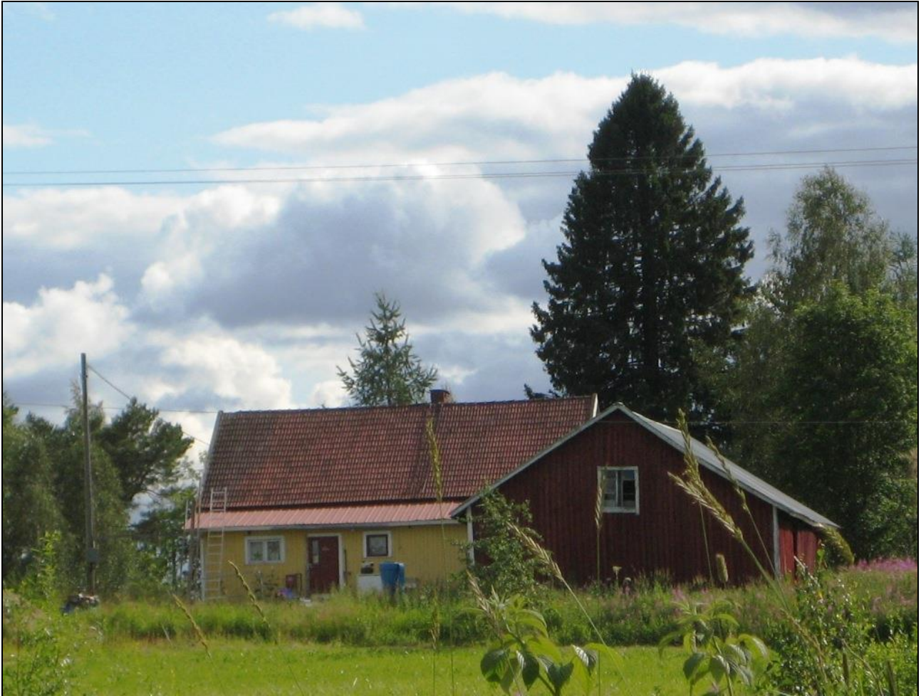
Kotajärven tilan rakennuksia kesällä 2009.