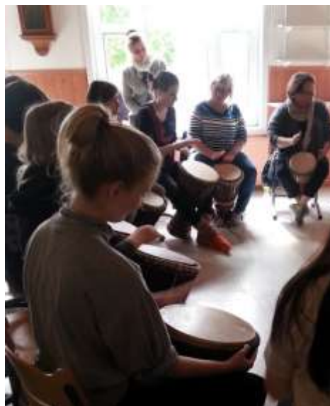
Perinneporina 2/2016 • 11

Kaikkien helkojen kanssa oli mukava esiintyäkin,