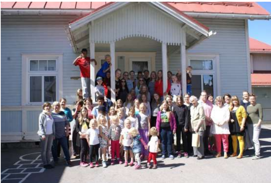
KESÄLEIRILLÄ LEMPÄÄLÄSSÄ 9.6-12.6.2016