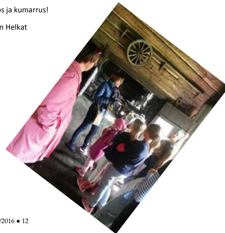
Perinneporina 2/2016 • 12